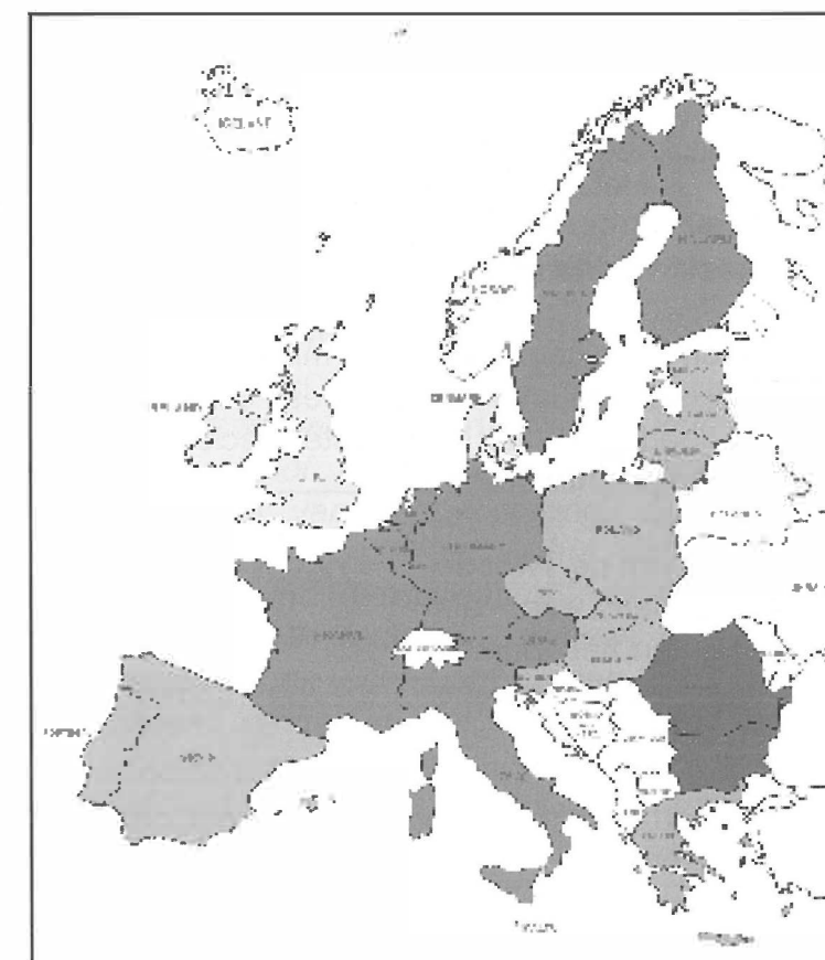
Europe in 2007

13. Voormeer informatie over (toekomstige) EU-uitbreidingen: http://ec.europa.eu/enlargement/index_en.htm .