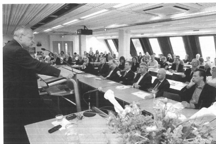
Oud-minister Klaas de Vries tijdens zijn rede op het symposium.

Het symposium in deze vorm als een samenwerking tussen het Departement Bestuurskunde en de Raad voor het Openbaar Bestuur bood een uitdaging voor de aanwezigen om op een intellectueel niveau en ook vooral vanuit persoonlijke ervaringen na te denken over een heikel onderwerp en de problematiek vanuit verschillende invalshoeken te bekijken. Wellicht dat een dergelijke dag een vervolg kan krijgen, door ook binnen het Leidse Bestuurskunde onderwijs met studenten en deskundigen vanuit de verscheidene expertises die het departement rijk is het debat aan te gaan over bestuurlijke vraagstukken.