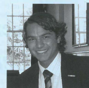
Door Amir Nazar