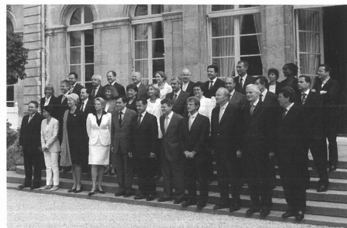
Presentatie van het kabinet-Fillon met president Sarkozy op de trappen van het Elysée-paleis.

Sinds de Napoleontische tijd is Frankrijk ook onderverdeeld in 100 départements , waarvan 96 op het vasteland. De verdeling was destijds ingesteld om hiermee de macht van de adel te doorbreken middels nieuwe machtseenheden. Alle departementen zijn genummerd, zoals ook te zien de Franse kentekenplaten. Departementen hebben een belangrijke taak bij het uitvoeren van nationaal beleid en zijn in dit opzicht ook belangrijker dan de regio's. Sinds 1982 hebben ze ook eigen bevoegdheden, vooral op het gebied van gezondheidszorg, wegen, sociale zekerheid en landbouw. Elk departement kent