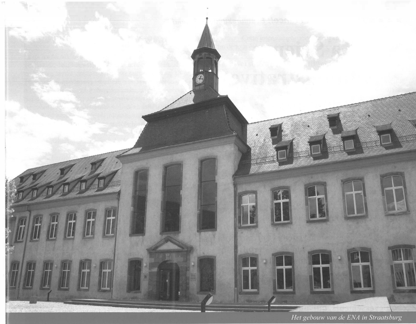
Het gebouw van de ENA in Straatsburg

De laatste jaren neemt de belangstelling voor de ENA echter af. Dat heeft meerdere oorzaken. In de eerste plaats is de belangstelling bij de jongeren voor functies bij de overheid geringer geworden. Veel studenten prefereren een goed