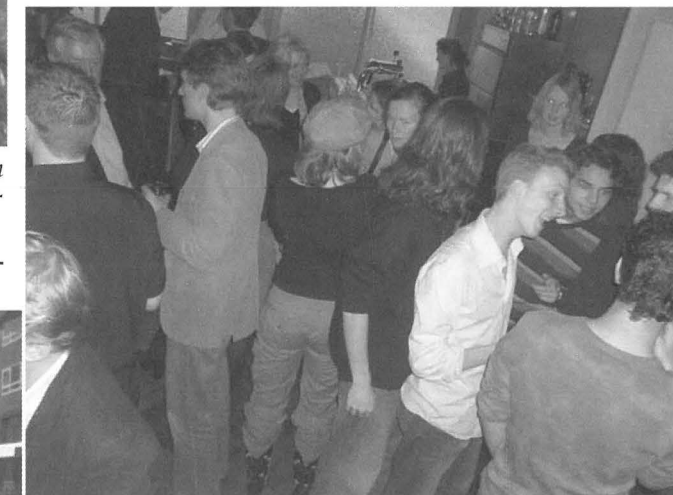
B.I.L.-borrel: student en politiek