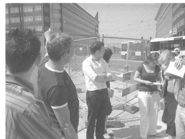
De wijk in tijdens de excursie naar de Amsterdamse Deelgemeente Bos & Lommer.