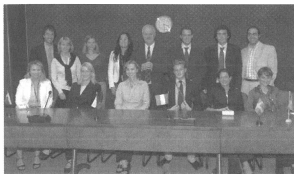
Stagiairs September met Ambassadeur Bruton

Door de verschillende soorten vragen en het lezen van vele dossiers krijg je een goed overzicht van wat de dagelijkse bezigheden van de Europese Commissie zijn. Het werk van een stagiair binnen de delegatie wordt gewaardeerd en er is ruimte om veel te leren binnen de delegatie. Zo heb ik naast het beantwoorden van vragen