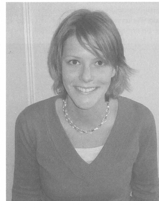
"Ik vind de B.I.L. een heel erg leuke vereniging!"

Nou, je hebt een primeur, want we gaan los! We zijn in bespreking met Quintus, want er komt een soort van partnership. Volgens de statuten moet zeventig procent van de