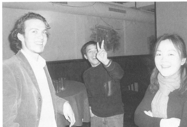
6 februari: lezing en borrel voor internationale studenten tijdens de International Fraternity Week