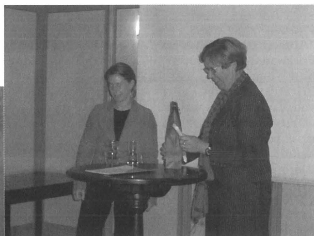
5 oktober 2005: Lezing Annemarie Jorritsma