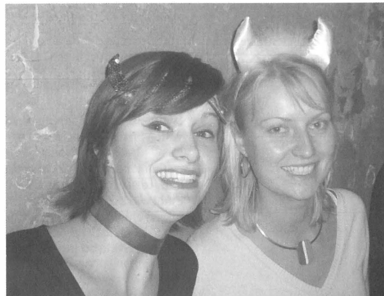
8 december: Angels vs. Devils-feest: