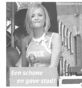
Campagneposter CDA Gemeenteraadsverkiezingen 2006

Daarnaast hebben de gebruikers geen plaats meer om de softdrugs te gebruiken. Men kan er dan redelijkerwijs vanuit gaan dat de softdrugs weer vaker in openbare plaatsen gebruikt zullen worden. Uiteraard is dit te ondervangen door een strengere 'blowverbod' op openbare plaatsen, maar de desbetreffende personen hebben al duidelijk aangegeven dat