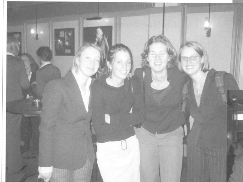
Een deel van LCB 2004