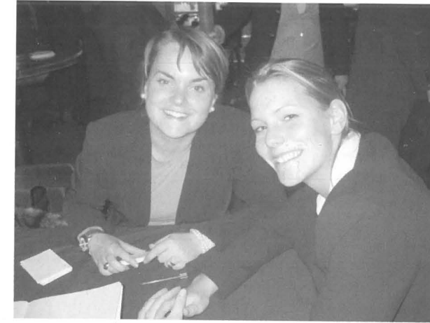
Groeten, uw gastenboekbewakers

De keuze voor de onderwerpen geschiedt door de raad zelf. In gezamenlijke vergaderingen met een open en informele sfeer worden de eerste brainstormsessies gehouden, waarna er besloten wordt welke onderwerpen wel en welke niet onderzocht zullen worden. Iedereen heeft hier dus iets in te zeggen. Ook worden de rapporten door iedereen gelezen zodat iedereen van alle onderzoeken op de hoogte is. Deze interdisciplinaire benadering is om eenzijdige rapportage te voorkomen en om de mensen scherp te houden, naast het feit dat mensen uit pure interesse op de hoogte willen blijven van andere projecten.