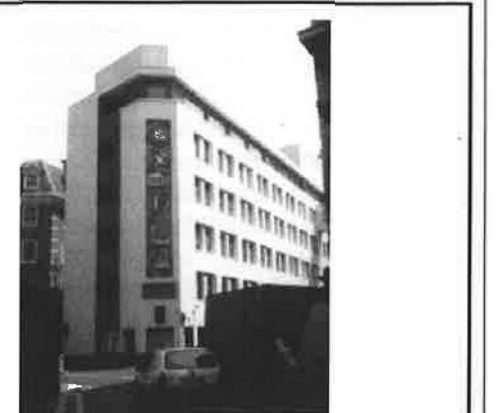
The London School of Economics

Door dit drukke programma was er eigenlijk alleen in de weekenden tijd voor enig toeristisch tijdverdrijf, zodat we uiteindelijk nog niet de helft van de bezienswaardigheden hebben bezocht die we vooraf in onze Capitoool-reisgids hadden aangetekend. Wat Londen erg plezierig maakt is dat de meeste musea gratis zijn. Wereldberoemde musea als het Tate Modern, the National Gallery en het British Museum zijn zeker de moeite waard. Wij hadden bovendien erg geluk met het weer en hebben met onze nieuwe vrienden Londen verkend.