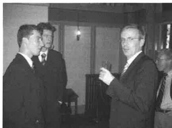
Zuurmond & Co. op de borrel van Zenc