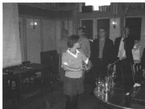
Op de bedrijvenborrel gaf Zenc een mooie presentatie