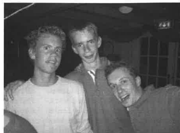
Ook de campingdisco was weer een succes