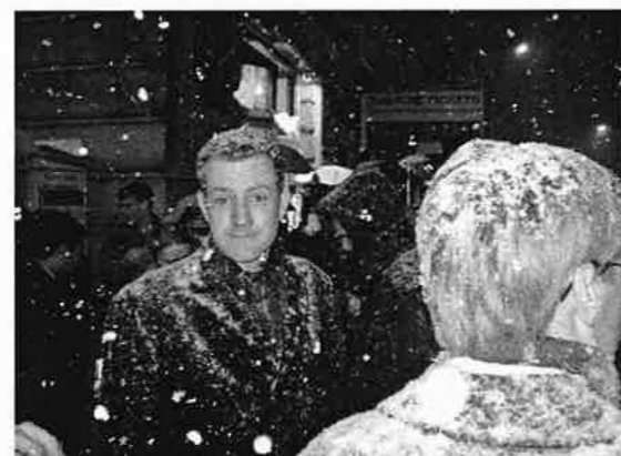
Door weer en wind