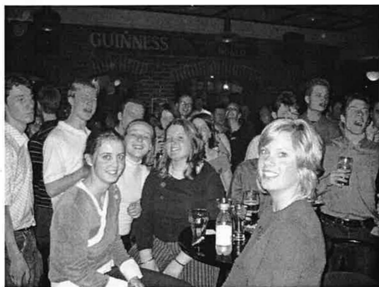
Pub in Londen