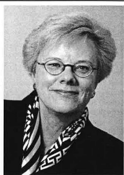
De trend in bestuurlijk Nederland is tegenwoordig afrekenen op resultaten. Hoe gaat de provincie hiermee om? We hebben een collegewerkprogramma

gemaakt, getiteld 'Vier jaar doen'. Juist dit college heeft in het kader van het eerder genoemde uitvoeren in plaats van nieuw beleid maken per beleidsterrein heel concrete doelen geformuleerd. Per jaar hebben we doelen gesteld en de Provinciale Staten kunnen ons dan ook hierop zowel individueel als collectief ter verantwoording roepen.