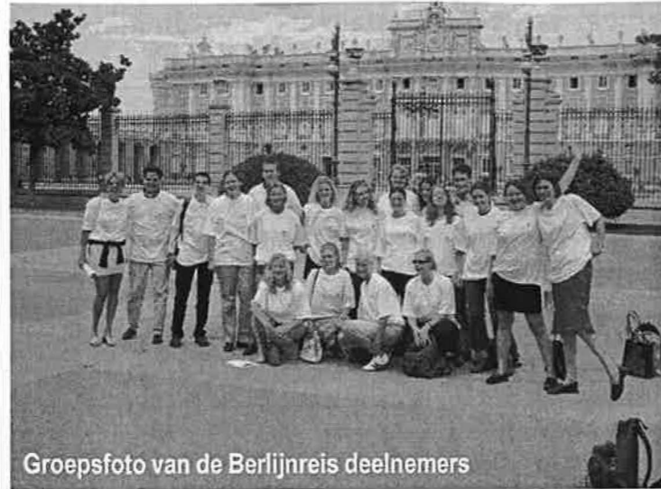
Groepsfoto van de Berlijnreis deelnemers