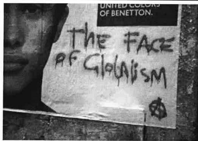
Anti-globalisten protesteren middels graffiti

"Heineken leek wel een beetje een staat op zich"