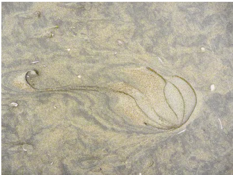
96.021. Harm Botman. Himantalia elongata (LVS64), uit de serie Veren van de zee , Langevelderslag Series , 2012

Door de diversiteit van elementen die in de foto's te zien zijn, lenen de foto's van Harm Botman zich beter voor een ecologisch of archeologisch begrip van het Nederlandse landschap. De foto's van Botman doen geen beroep op een historische zienswijze op het Nederlandse landschap; in plaats daarvan richten ze onze blik en aandacht op de bekoring van grillige organische vormen van water en zand bij de brandingslijn, dieren en andere levende en niet-levende elementen waaruit het landschap bestaat. De foto's van Worms leggen extra nadruk op de vlakheid van het landschap en liggen dicht bij topografische beelden van het Nederlandse landschap. Dit is de vorm die het Nederlandse landschap had gedurende de lange traditie van de landschapsschilderkunst. Deze traditie begon bij de Hollandse topografische prenten van eind zestiende- en begin zeventiende eeuw. Worms' benadering sluit aan bij de landschapsfotografie van de zogenaamde New Topographics . New Topographics was een tentoonstelling in het George Eastman House in Rochester (USA) in 1975, waarin