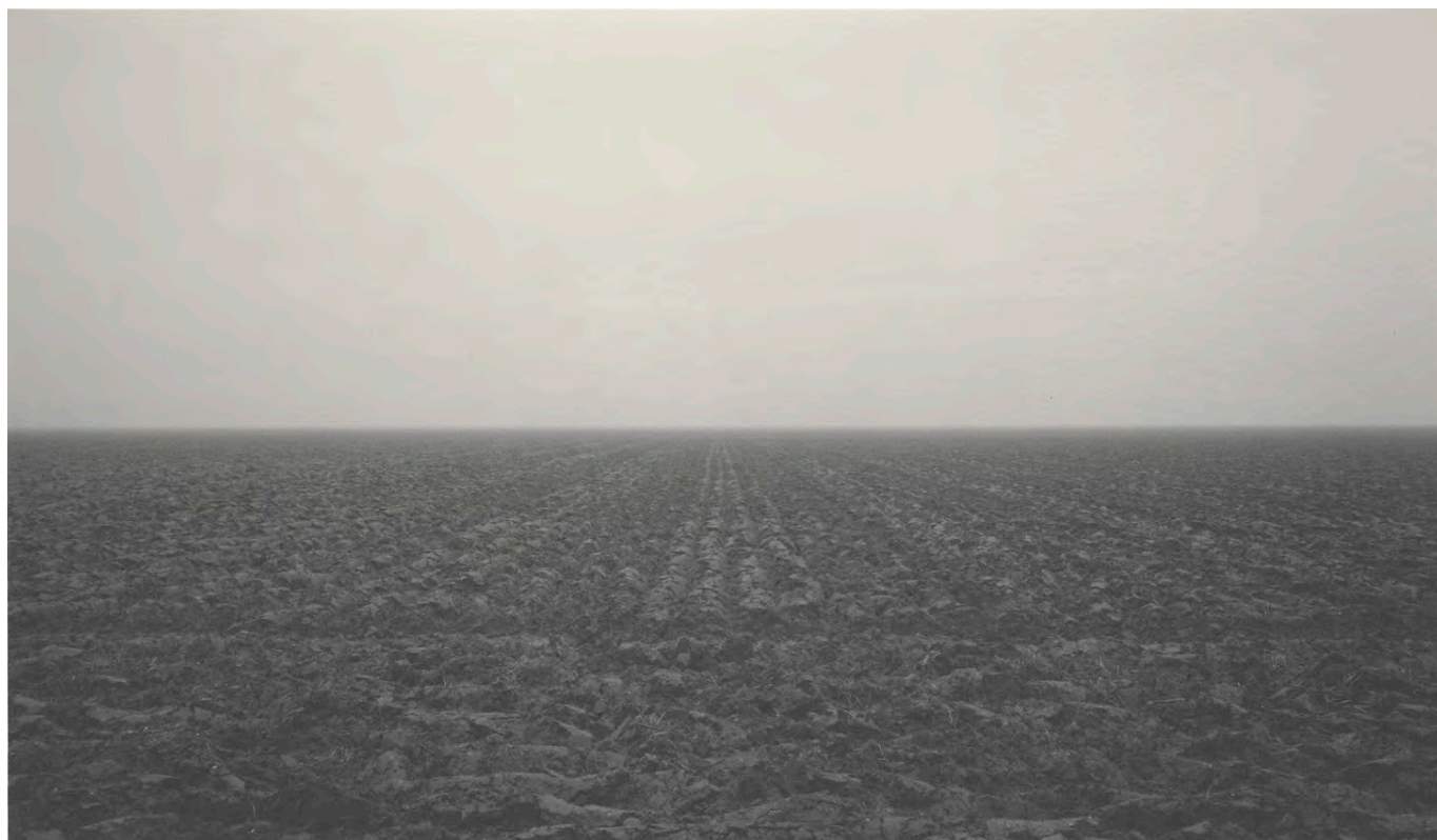
96.020. Witho Worms. Polderland 10 , 2005, uit de serie polderlandschappen van de Flevo- en Noordoostpolder

de Langevelderslag, de Waterleiding- en de Kennemerduinen. Het zijn openbare stranden en duingebieden, die populair zijn voor zwemrecreatie of een wandeling door de frisse zeewind. Het duinlandschap is op natuurlijke wijze ontstaan door sedimentatie van zand uit zee. Door afkalving van de kust wordt deze tegenwoordig echter weer in hoge