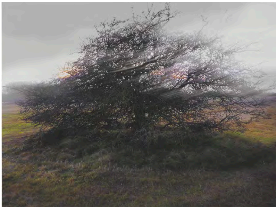
96.023. Harm Botman. Crataegus Monogyna (LVS70), uit de serie Veren van de zee , Langevelderslag Series , 2012