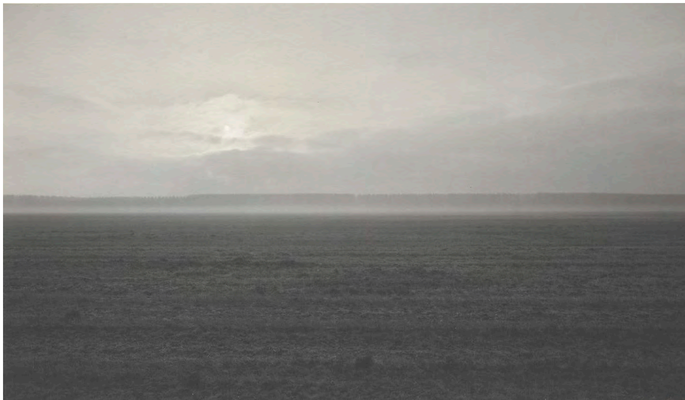
96.019. Witho Worms. Polderland 4 , 2005, uit de serie polderlandschappen van de Flevo- en Noordoostpolder

Universiteit Leiden heeft de afgelopen periode meerdere projecten met het thema landschapsfotografie verworven. Dit stuk bespreekt twee voorbeelden: een serie polderlandschappen gefotografeerd door Witho Worms (1959) en een serie kustlandschappen van fotograaf Harm Botman (1952 – 2012). Ali Shobeiri, de nieuwe universitair docent bij de masteropleiding Film and Photographic Studies, benoemt in dit artikel de twee heel verschillende zienswijzen van deze fotografen. De series creëren ieder op hun eigen manier een 'plaatsgevoel', ofwel 'sense of place'.