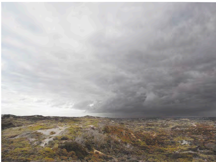
96.022. Harm Botman. Zonder titel (LVS07), uit de serie Veren van de zee , Langevelderslag Series , 2012