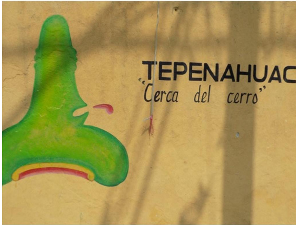
Imagen 19. Paisaje Lingüístico. Tepenahuac 78. Glifos toponímicos de los pueblos de Milpa, Alta. Iglesia de Santa Ana Tlacotenco.