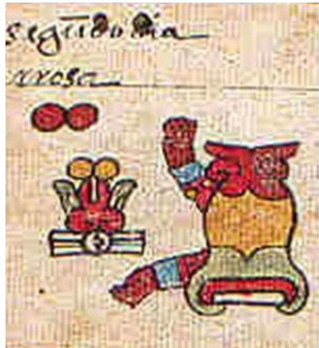
Imágenes 12 y 13 Códice Telleriano Remensis. Lámina 22 Códice Cihuacoatl (Borbónico). Lámina 8. Tepeyollohtli, “el corazón de la montaña”.

tepeyollohtli que son muy valiosas para profundizar nuestro entendimiento.