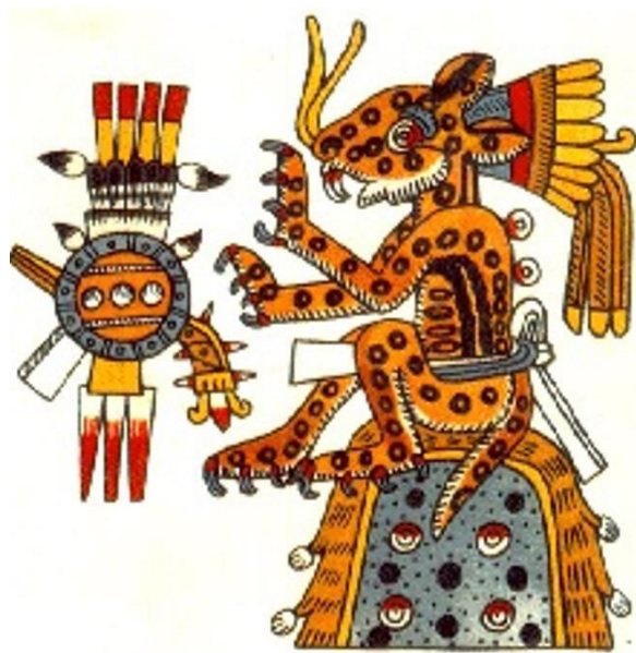
Imagen 11. Tepeyollohtli. Códice Borgia (Yohualli Ehecatl). Lámina 63.

El estudio del primer caso: tepeyollohtli “el corazón de la montaña” es clave, pues hace explícito que las montañas son consideradas como “entidades animadas”, es decir, dotadas de vida. El significado de la expresión tepeyollohtli “el corazón de la montaña”, no ha de entenderse de manera literal, sino que se trata de una expresión que en sentido figurado se refiere al campo semántico de la vitalidad, y simbólicamente se refiere al “espíritu de la montaña”, o al “dueño del cerro”, es decir, a la entidad sagrada que la habita y la protege.