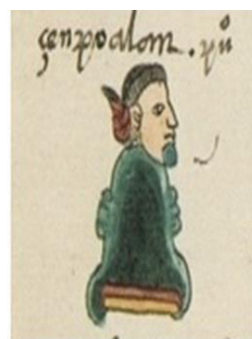
Imágenes 15, 16, 17 y 18. Códice Mendoza o Códice Moctezuma. Bodleian Library, Oxford.