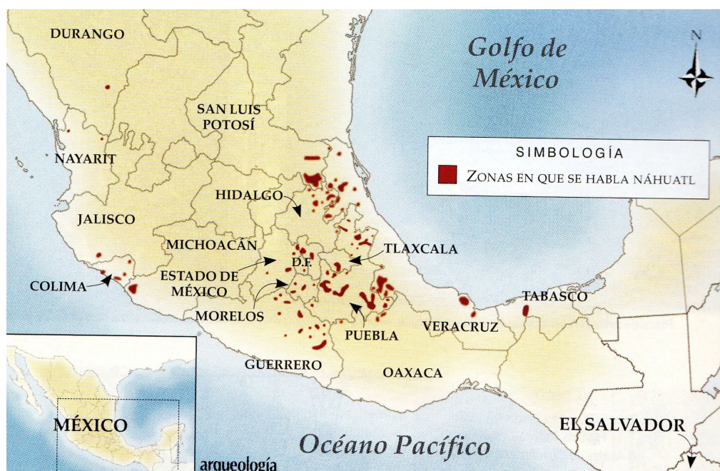
Imagen 1. Mapa. Zonas donde se habla náhuatl. Revista Arqueología mexicana.

trabajo de los estudios filosóficos precedentes, (León Portilla, 1993 [1956]; Gingerich, 1987; Descola, 2013 [2005]; Maffie, 2014) que han concentrado su atención en el estudio de la filosofía azteca , esta investigación tiene como objetivo, el análisis de la sabiduría, pero tomando como punto de partida el análisis de los procesos cognitivos y “metáforas ontológicas” presentes en el idioma náhuatl.