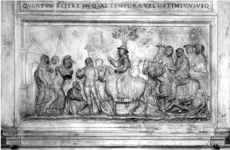
Afb. 7: Baldassare Peruzzi, Michelangelo da Siena en Niccolò Tribolò: De intocht van paus Adrianus VI in Rome . Reliëf van het grafmonument van Paus Adrianus VI, 1524-29. Rome, Santa Maria dell'Anima.

aan hem, maar aan de omstandigheden (lees: de tegenwerking door de curie). Adrianus was een goede man, maar op het verkeerde moment.