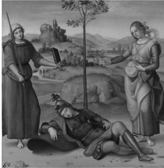
Afb. 5: Rafaël: De droom van Scipio . Olieverf op paneel (170 x 170 mm), ca. 1504. Londen, National Gallery.

in zijn carrière maakte, omstreeks 1504. Het toont een Romeinse soldaat in accoude houding in een landschap, met ter weerszijden een dame met diverse attributen in de handen (afb. 5). 15 De voorstelling is gebaseerd op teksten van Romeinse auteurs als Cicero en Macrobius, en de veertiende-eeuwse Italiaanse schrijver Francesco Petrarca. De soldaat is de Romeinse held Scipio Africanus maior, die in een droom twee dames ziet.