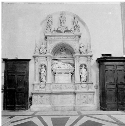
Afb. 1: Rome, Santa Maria del Popolo: koorkapel, met het grafmonument van Ascanio Maria kardinaal Sforza. Recht hier tegenover (niet zichtbaar op de foto) staat het grafmonument van Girolamo kardinaal Basso della Rovere. Beide grafmonumenten zijn gemaakt door Andrea Sansovino.