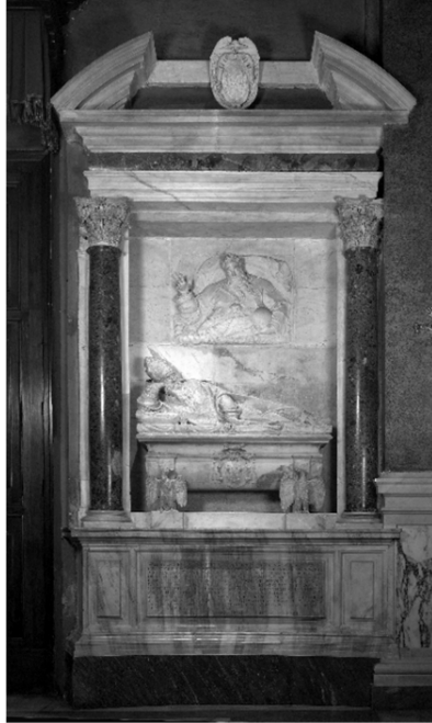
Afb. 8: Giovanni Mangone: Grafmonument van Willem kardinaal van Enckenvoirt, 1538-40. Rome, Santa Maria dell'Anima. Het monument staat niet meer op zijn oorspronkelijke plaats in de koorkapel, tegenover het grafmonument van paus Adrianus VI, maar tegen de ingangswand van de kerk.