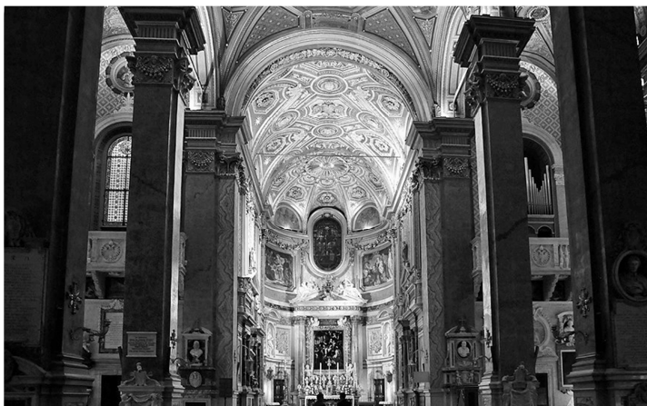
Afb. 2: Rome, Santa Maria dell'Anima: koorkapel, met rechts het grafmonument van paus Adrianus VI en links, op de plaats waar oorspronkelijk het grafmonument van Willem kardinaal van Enckenvoirt stond, het grafmonument van Karl Friedrich van Gulik-Kleef-Berg.