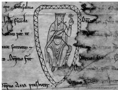
Afbeelding 3 Oorkonde van Urraca (detail), 1204. Perkamant, 31,9 x 25,6 cm. Zamora, Archivo de la Catedral, ACZa 8/24.

Dat blijkt niet alleen uit alleen het zegelkoord, maar ook uit de clausule waarin 'koningin vrouwe Urraca' aangeeft dat ze de oorkonde liet maken en het geheel met haar zegel verzekerde. 40 Zo informeert de koningin dat zij de opdracht gegeven heeft de oorkonde op te laten stellen en dat zij de juridische inhoud samengesteld en bevestigd heeft, en dat het document gecertificeerd is met het aanhangen van het zegel dat nu verloren is. Behalve een was zegel, liet zij onderaan het perkament ook een getekend 'signum' achter, een persoonlijk teken in inkt dat in twaalfde-eeuwse Iberische oorkonden regelmatig voorkomt. Het is doorgaans rond ('signum rodado'), bevat de naam van de uitvaardiger en in het geval van Urraca's echtgenoot Fernando ook een leeuw. 41 In tegenstelling tot traditionele signa die rond zijn, is in de oorkonde van Urraca de typische wapenschild-vorm van Portugese zegels overgenomen. Hoewel we alleen maar kunnen gissen naar het uiterlijk van Urraca's was zegel, zou dit wel eens zeer vergelijkbaar met dat van haar zus Mathilde geweest kunnen zijn.