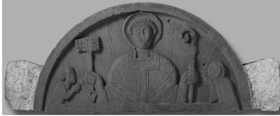
Afbeelding 1 Timpaan van Egmond, 1121-1143, bontzandsteen en lood, h 88 × b 175 × d 12,5 cm. Amsterdam, Rijksmuseum, BK-NM-1914.

In de overgeleverde middeleeuwse documenten worden Petronilla's schenkingen van een dorsale en een kazuifel genoemd, maar het timpaan is nergens te bespeuren. 14 Het beeldhouwwerk zelf is daarom de voornaamste bron die iets over functie en betekenis kan melden. De sleutel en staf, samen met de inscriptie op de bovenrand 'O, poortwachter van de hemel, laat deze met gelovig hart voor u knielende menigte binnenkomen en verzoen haar met de hemelse koning,' maken duidelijk dat de centraal afgebeelde figuur Petrus is. 15 De knielende figuren die hem flankeren kunnen worden geïdentificeerd op basis van de inscriptie op de onderrand 'Hier bidt Dirk - Petronilla versiert dit werk' zijn niemand anders dan graaf Dirk VI en zijn moeder gravin Petronilla. 16 Op het eerste gezicht lijkt dit een duidelijke inscriptie. Een baardloze en dus mogelijk jonge Dirk (ca. 1114-1157) staat aan de uitverkoren rechterzijde van Petrus, de handen in devotie geheven en klaarblijkelijk biddend. Zijn moeder Petronilla die een mantel en onderkleed met wijde mouwen draagt, is ook biddend geportretteerd. Maar de gravin deed meer, want volgens de inscriptie 'versierde' zij ook, waarmee niet bedoeld is dat de gravin het werk zelf vervaardigde, maar dat zij het timpaan of de nieuwbouw van de kerk, waarvoor zij volgens het Gravenregister dertien pond schonk,