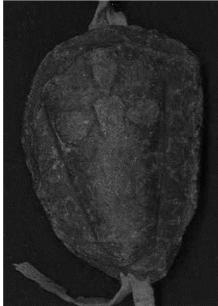
Afbeelding2 Oorkonde van Sancho I, 1191. Perkament, 45 x 32,2 cm. Ordem de Avis e Convento de São Bento de Avis, mç. 2, n.º 103. Digitaal in Arquivo Nacional Torre de Tombo, PT/TT/OACSB/001/0002/00103

wapenschildvorm te geven. Bovendien wordt op de achterzijde van de beide zegeltypes het Portugese familiewapen, bestaande uit vijf kleine schildjes die een kruis vormen, toegevoegd. Middels vorm en heraldiek verbond Mathilde zich nog explicieter aan het Portugese koningshuis waar dezelfde zegelontwerpen gevoerd werden door haar vader Afonso en haar broer Sancho. 36