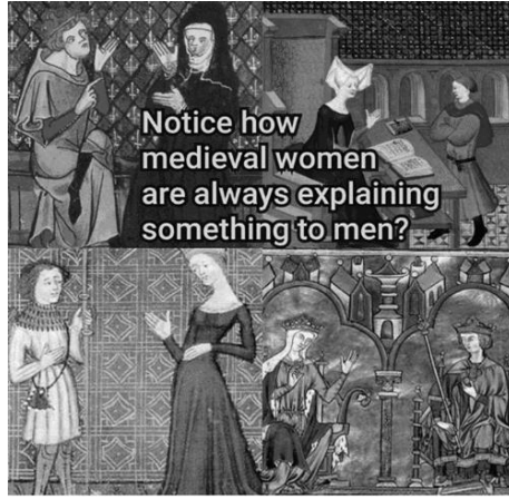
Afbeelding 7: Vier afbeeldingen waarop middeleeuwse vrouwen in een uitleggende houding gebaren naar een middeleeuwse man. Het doel van spot is enerzijds de vrouwenonderdrukking in de eigen tijd en anderzijds de overdreven eigentijdse opvattingen over de ondergeschiktheid van vrouwen in de middeleeuwen. 29

Veel van het komische mediëvisme in deze internetmemes heeft geen ander doel dan grappig zijn. Maar soms is dit soort memes dubbelzinniger: de humor kan een ernstige ondertoon hebben of gebruikt worden om bepaalde maatschappelijke waarden of vooroordelen te bevestigen. 30 Zo maken twee van de hierboven gegeven voorbeelden gebruik van satire om de spot te drijven met hetzij hedendaagse ideeën hetzij middeleeuwse opvattingen over de positie van vrouwen (afb. 6 en 7). In dat opzicht, zo stelt D’Arcens, kan modern satire als ‘forward-looking in its aspirations’ gemakkelijk worden gecombineerd met (neo)mediëvismen als ‘backward-looking in [their] inspirations.’ 31 Een belangrijke vraag is alleen op wie de spot dan feitelijk gericht is. Op de hedendaagse internetgebruiker of op (mensen in) de middeleeuwen? D’Arcens denkt op beide, dat hier sprake is van ‘satiric