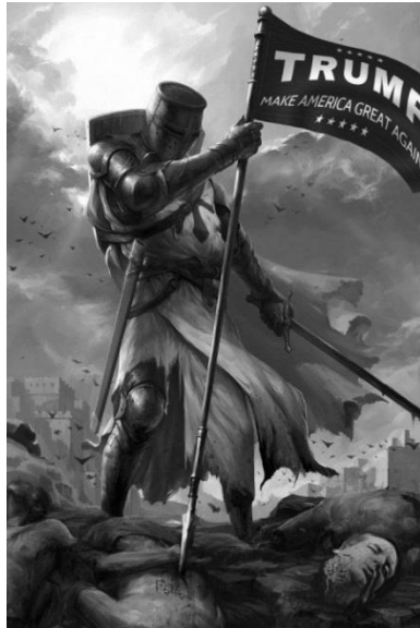
Afbeelding 14. Kruisvaarder in een Romantische pose. De vlag voert de campagneslogan 'Trump, Make America Great Again.' Vermoedelijk stelt het afgehakte hoofd rechtsonder Ted Cruz voor, één van Trumps tegenstanders in de strijd om het presidentschap in 2016. 55

Een andere recente gebeurtenis waarbij veel kruisvaardermemes werden gedeeld, was de verkiezingscampagne van de Republikeinse presidentskandidaat Donald Trump in 2015-2016. De voorbeelden hieronder betreffen memes van Trumpaanhangers als kruisvaarders met een Trumpvlag en het afgehakte hoofd van een Republikeinse rivaal (afb. 14).