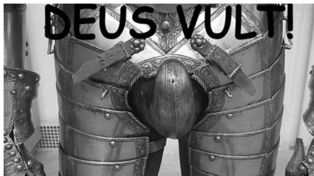
Afbeelding 10: Een foto van een harnas met penisbeschermer uit de Renaissance (ze bestonden echt!). De begeleidende tekst 'Deus vult' suggereert dat het idee van een kruistocht mannen in staat van grote opwindning brengt. 36

BritainFirst en de English Defense League is het satirische account BritainFirst . Op dit account worden spel- of stijlfouten in de berichten van extremistisch-nationalistische of pro-Brexit- of anti-islam groeperingen belachelijk gemaakt. Soms worden de oorspronkelijke berichten nét iets veranderd om ze bespottelijk te doen klinken, terwijl in andere gevallen de oorspronkelijke berichten al dusdanig lachwekkend worden bevonden, dat ze ongewijzigd worden doorgegeven (afb. 12).