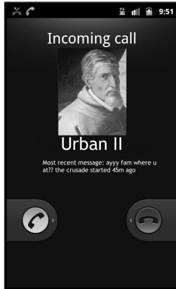
Afbeelding 9: Achtergrond van een smartphone die gebeld wordt door paus Urbanus II naar aanleiding van een eerder verzoek om deel te mogen nemen aan de kruistocht. Hierbij worden een persoon en een gebeurtenis uit de middeleeuwen naar de eigen tijd toegehaald. De middeleeuwen zijn niet het doel van spot. 34

Bij humoristische internetmemes is de grens tussen grap en belediging, of tussen neutraal en politiek geladen, vaag. Een manier waarop politieke opvattingen in humor verpakt worden, is superioriteitshumor. Daarbij probeert een enkele persoon of een bepaalde groep zichzelf boven een andere persoon of groep te plaatsen door om de ander te lachen (afb. 10). 35 Een variant is om een algemeen bekend historisch fenomeen, bijvoorbeeld de kruistochten, en die dan weer gereduceerd tot de slogan 'Deus vult', op een grappige manier in te zetten tegen bepaalde sociale geledingen. Een voorbeeld van een Facebook-account dat volledig gewijd is aan superioriteitshumor ten opzichte van de rechts-extremistische groepen zoals