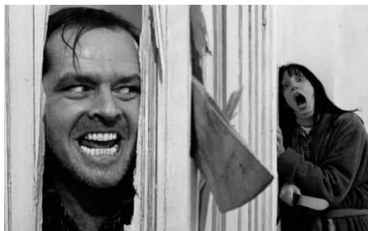
Afbeelding 1: Iconische scene uit The Shining waarbij de hoofdrolspeler Jack Nicholson een gat in de badkamerdeur hakt, om

intertekstuele transformatie. 14 De transformatie kan op verschillende manieren beschreven worden. 15 In het geval van afbeelding 2 is de vorm van de grondtekst behouden, maar de inhoud gewijzigd door invoeging van een tempelier en een generieke ‘moslimterrorist’. Verder is de stance in afbeelding 2 ingegeven door de bijgevoegde tekst ‘Deus Vult!’ (God wilt), een kruisvaarders-mediëvalisme, in plaats van de tekst ‘Here’s Johnny’ uit het origineel. De intertekstuele relaties in afbeelding 2 bestaan dus uit het behoud van de scene-opstelling uit The Shining , die vervolgens wordt verbonden met de betekeniszwangere tekst ‘Deus Vult!’ gekoppeld aan verschillende kruisvaarders-mediëvismen. De memes zijn vaak humoristisch bedoeld en/of politiek geladen, maar men moet de verwijzingen/toespelingen dan natuurlijk wel snappen. Ook kunnen onder de dekmantel van komische mediëvismen eigentijdse sociale en politieke spanningen schuil gaan.