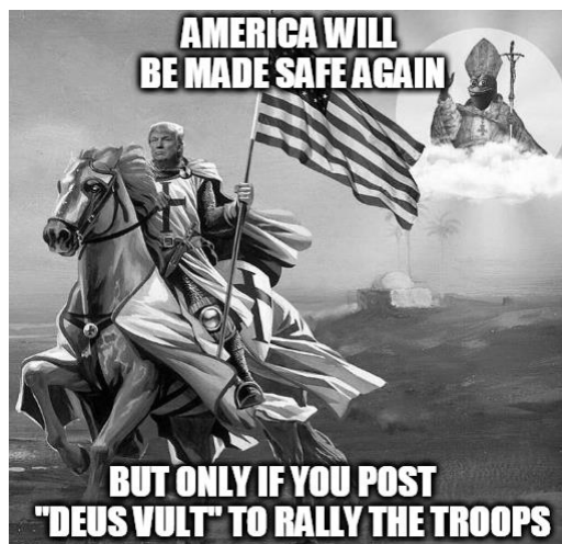
Afbeelding 15: Trump romantisch afgebeeld als tempelier rijdend op een paard door een oriëntalistisch landschap, gadeslagen door het bekende meme character Pepe de kikker als paus. De tekst suggereert dat Amerika weer veilig zal worden, als deze meme maar gedeeld wordt met de tekst 'Deus Vult'. Gepost op Reddit 19-09-2016. 56

Het is dus geen toeval dat dit soort memes tijdens de campagne doelbewust zijn ingezet om Trumps politieke boodschap te ondersteunen en daarmee de verkiezingen te beïnvloeden. Ook nadat Trump was gekozen, bleef hetzelfde type memes haast ritueel terugkeren, telkens als de president iets belangrijks deed. De krantenkop met foto bij een nieuwsbericht over de inauguratie-speech van Trump waarin hij beloofde radicaal-islamitische terreur uit te roeien, werd aangepast door Trumps hoofd van een kruisvaardershelm te voorzien en de geuzenleus 'Deus Vult' toe te voegen (afb. 16). Dat laatste is ook gebeurd met een nieuwsbericht over een in brand gestoken moskee in Texas (afb. 17).