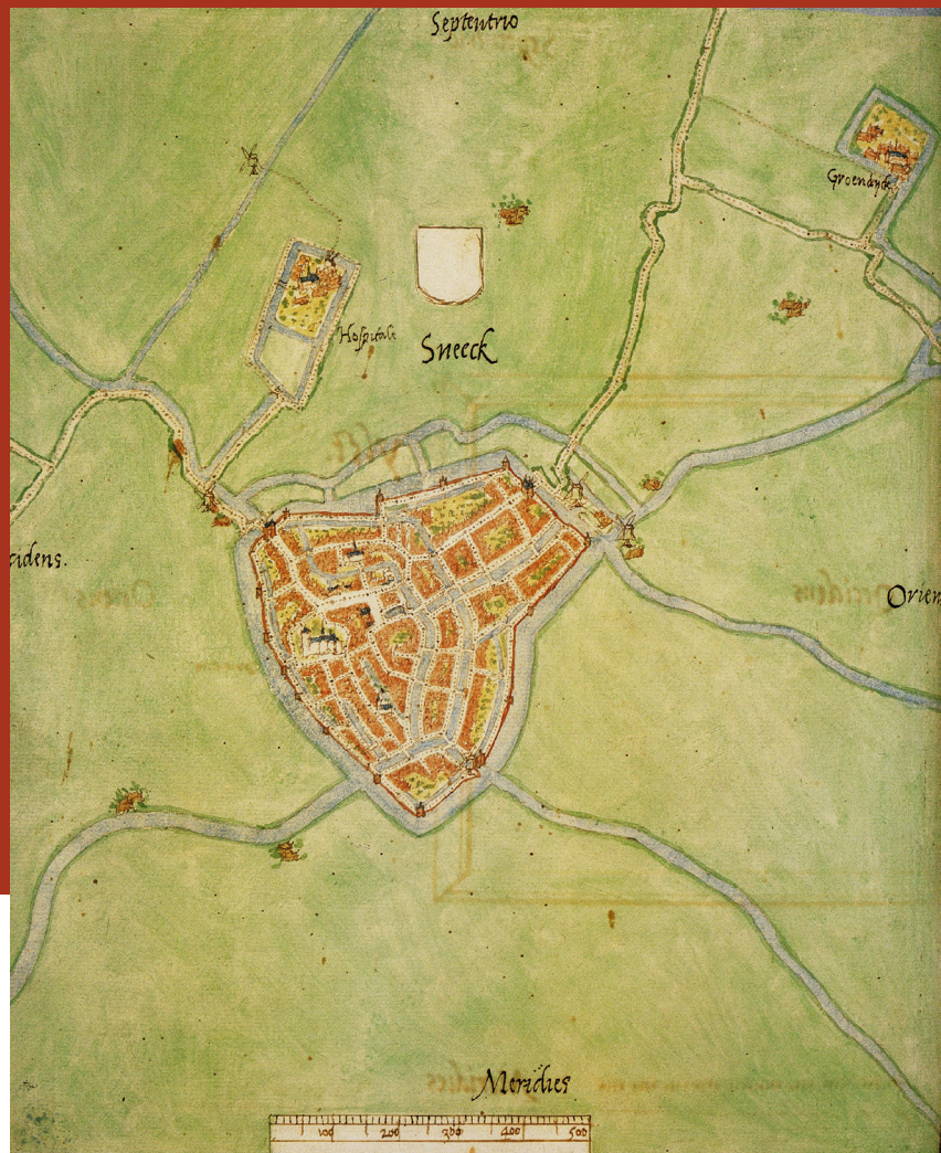
Klooster Groendijk (rechtsboven) op de kaart van Van Deventer (ca. 1560).

Bij dat alles hadden de partijen eveneens elkaars pachters lastig gevallen en schade berokkend. In de zoenbrief nu werd alle schade, doodslag en letsel van beide partijen tegenover elkaar geplaatst en getaxeerd, waarbij het nodige tegen elkaar werd weggestreept, maar van de