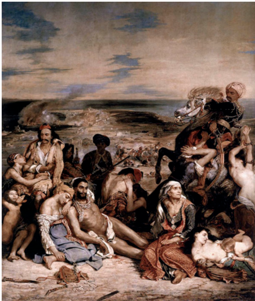
Scène des massacres de Scio, schilderij van Eugène Delacroix (1824); Louvre.

vele contacten ter plaatse de bevoorrading in het tot chaos vervallen Griekenland op gang wist te houden. Veel welgestelde filhellenen gingen ook over tot het verstrekken van leningen uit eigen zak aan de provisionele Griekse regering. Weer anderen verleenden steun aan Griekse vluchtelingen die hun vaderland ontvlucht waren.