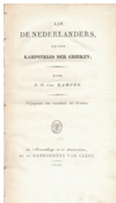
Titelblad van het pamflet 'Aan de Nederlanders, bij de kampstrijd der Grieken' (1827).

te verbinden met de goede zaak, in zijn geschrift de Griekse strijd tegen de Ottomaanse onderdrukking nadrukkelijk op één lijn met de Nederlandse Opstand tegen Spanje. De sultan werd daarbij gelijkgesteld aan Filips, het optreden van de Griekse krijgsheren herinnerde in zijn optiek aan de bestorming van Den Briel, en het beleg van Missolonghi deed denken aan dat van Leiden of Haarlem.