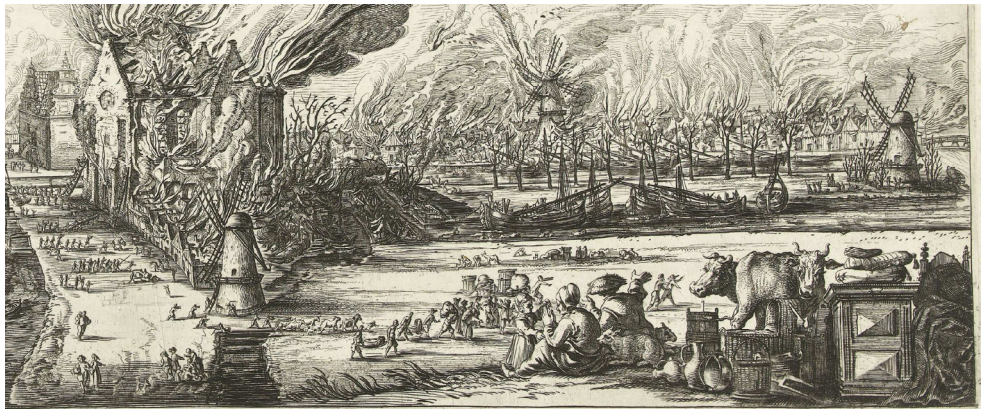
Afb. 22 Salomon Savery, De Rijk vóór en tijdens de grote brand van 1654 (detail). Rijksmuseum Amsterdam, RP-P-OB-81.819. Ets en gravure op papier.