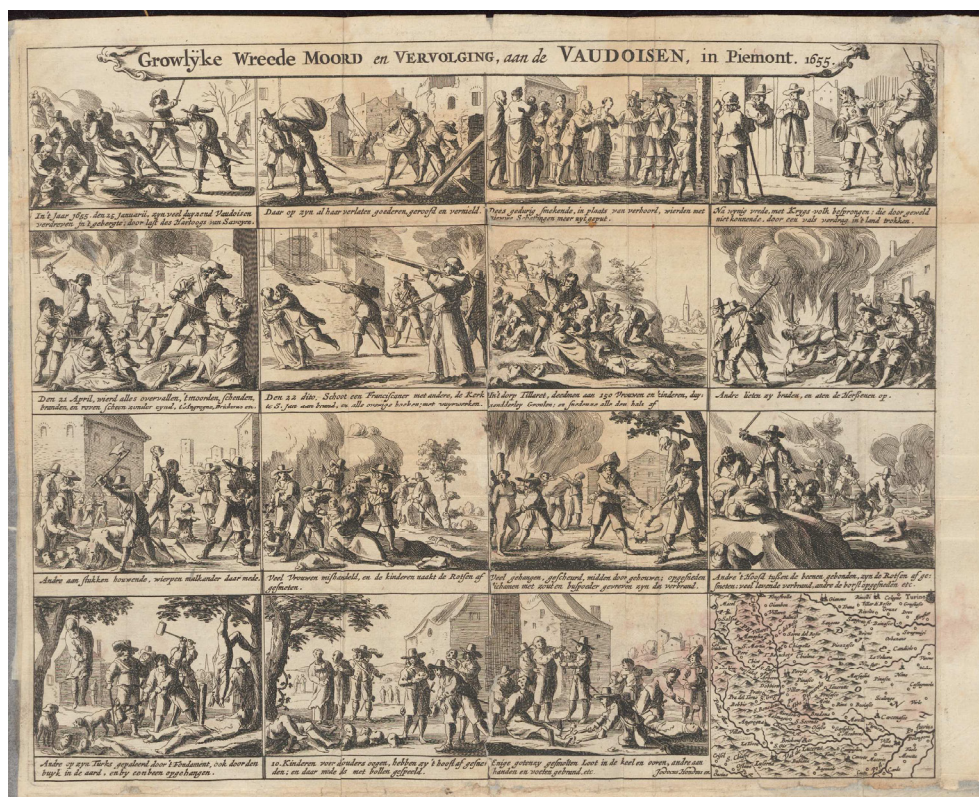
Afb. 5 Jodocus Hondius, Grouwelijke moord (1655). Universiteitsbibliotheek Leiden, BWB 755.

Medio mei trokken de protestantse Zwitserse kantons aan de bel over de 'ellendige staet' van de waldenzen. 32 Vlak daarna besloten de Staten-Generaal tot een diplomatieke interventie. 33 Begin juni arriveerde bovendien een dringend verzoek van Oliver Cromwell, Lord Protector van Engeland, die alle protestantse staten probeerde te mobiliseren ter preventie van 'any danger which may happen to us all [i.e. protestants Europa] by the example and