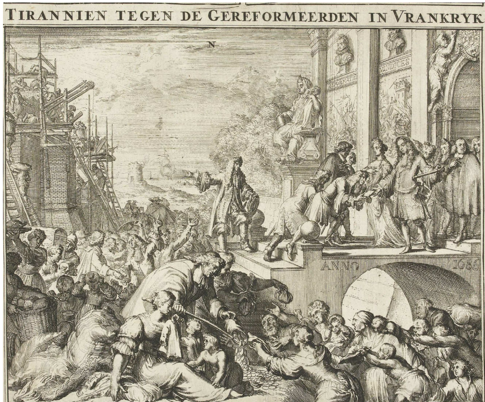
Afb. 7 Ontvangst hugenoten in de Republiek, detail van Romeyn de Hooge, Tirannien tegen de Gereformeerden in Vrankrijk (1686). Rijksmuseum Amsterdam, RP-P-OB-55.182. Ets op papier.

zorg voor Franse immigranten was een bron van interconfessionele spanningen in de Republiek.