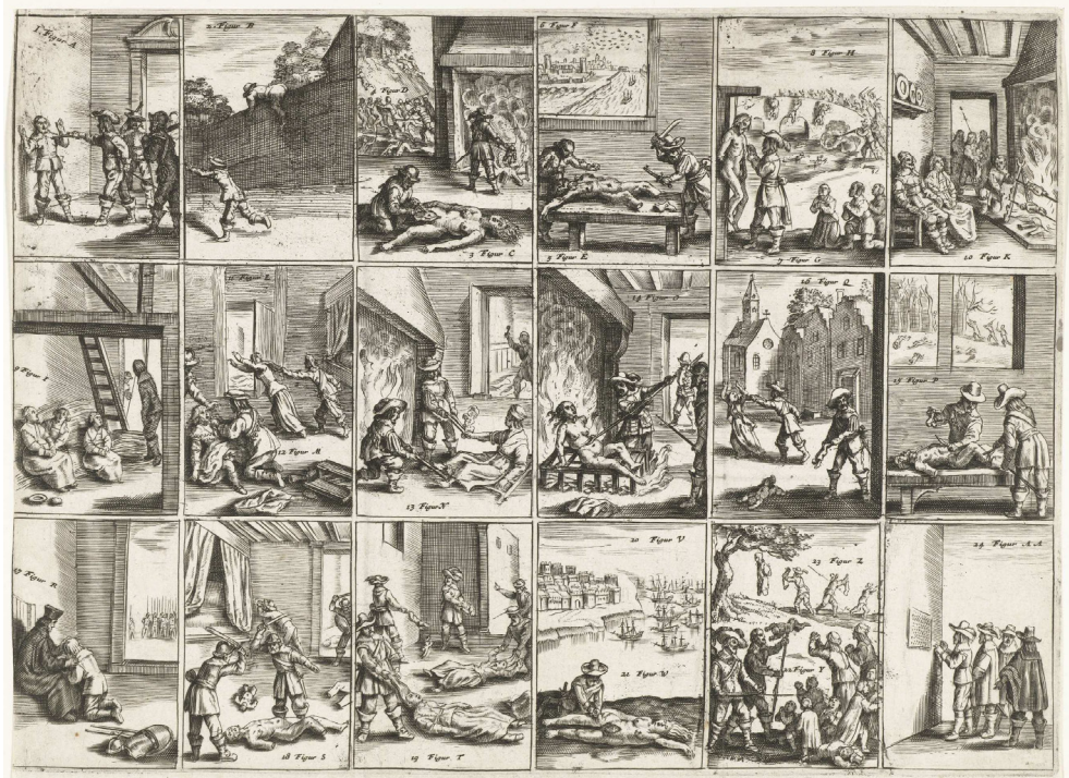
Afb. 2 ‘Schildery des bloedts’, James Cranford, Yrelantsche traenen [...] (Amsterdam: Broer Jansz. en Jan van Hilten 1642). Rijksmuseum Amsterdam, RP-P-OB-81.508A. prentmaker anoniem, prent naar Wenceslaus Hollar. Gravure op papier.

weer werden vertaald, uitgelegd en bediscussieerd. 11 Het Engelse conflict vloeide daardoor snel over naar de Republiek, waar een heftige strijd ontbrandde om de politieke steun. Aanvankelijk ging de polemiek over de Ierse Opstand, vanaf 1643 over het buitenlandse beleid van de Republiek.