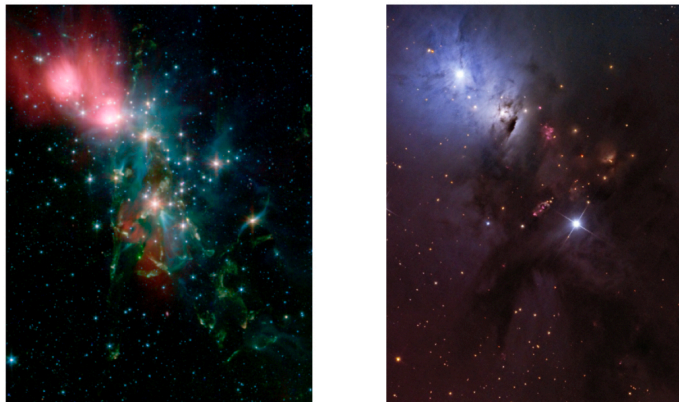
Figuur 1: Links: Spitzer samengestelde afbeelding van het NGC1333 stervormingscomplex in de Perseus moleculaire wolk. Kleuren representeren verschillende golflengtes van de waarnemingen: 3.6\ \mu\text{m} (blauw), 4.5\ \mu\text{m} (groen), 5.8\ \mu\text{m} (oranje), 8.0\ \mu\text{m} (rood). Rechts: Afbeelding van hetzelfde gebied in het optisch in een blauwe, groene en rode filter.

De nieuwsgierigheid naar hoe de Aarde, planeten en de Zon zijn gevormd geeft een constante drang naar nieuwe astronomische ontdekkingen. Het is geen verrassing dat we met elke nieuwe technologische ontwikkeling - beginnende bij een simpele handtelescoop ontwikkeld door Lippershey en gebruikt door Galileo, tot de Very Large Telescope met een diameter van 8 meter en de 66 radio antennes van de Atacama Large Millimeter/submillimeter Array - proberen te leren over onze herkomst door naar de hemel te kijken. De ontdekkingen van de afgelopen 30 jaar hebben laten zien dat ons zonnestelsel slechts één voorbeeld is van de vele planetenstelsels rondom andere sterren, met meer dan 4000 planeten die tot op heden ontdekt zijn. Om uit te vinden hoe deze planeten gevormd worden is het niet genoeg om alleen planeten waar te nemen die al geboren zijn, maar is het ook essentieel om onze telescopen te richten op de geboorteplaatsen van sterren en planeten: moleculaire wolken.