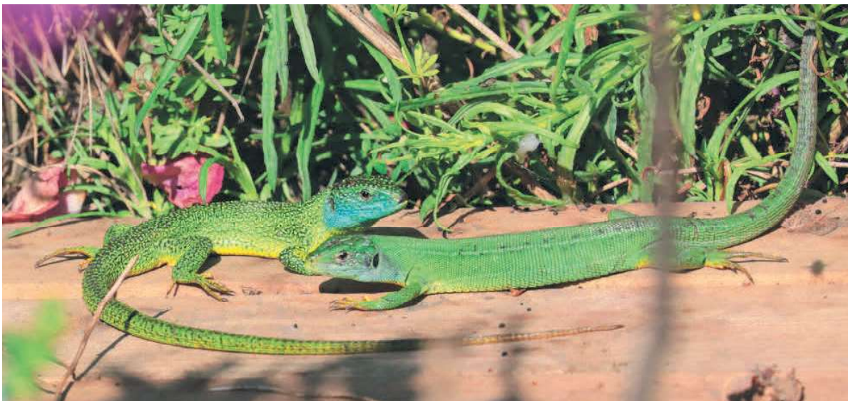
Paartje westelijke smaragdhagedissen, gefotografeerd in Scheveningen.

Smaragdhagedissen zijn gewaardeerde terrariumbewoners en de kweek geeft over het algemeen weinig problemen. De geïntroduceerde populatie in Scheveningen vindt dan ook haar oorsprong in de terrariumhobby. Bekend is dat in ieder geval rond 1995/1996 terrariumdieren zijn uitgezet. Deze informatie is gebaseerd op een interview met de uitzetter, die vlakbij de locatie in kwestie woont. Omdat er op het duin ook beschermde zandhagedissen leefden en er plannen voor ruimtelijke ontwikkelingen waren, heeft er in 2017 een wegvang- en verplaatsingsactie van zandhagedissen plaatsgevonden. Daarbij is de kans direct aangegrepen om de exotische smaragdhagedissen uit het gebied te verwijderen. In totaal zijn er toen elf smaragdhagedissen weggevangen. Hoewel er nadien geen zandhagedissen meer zijn waargenomen, bleek de smaragdhagedis nog wel aanwezig. Tijdens veldbezoeken in 2019 en 2020 is vastgesteld dat er in 2018 en 2019 nog succesvolle voortplanting heeft plaatsgevonden. Medio 2020 zijn nog slechts enkele dieren gezien, waarvan nog maar één adult dier, een vrouwtje.