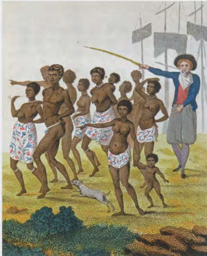
ZOUTWATER-NEGERS DOOR HET VERBOD VAN 1815 STOKTE DE AANVOER VAN NIEUWE SLAVEN Ets uit 1796 van J.G. Stedman.