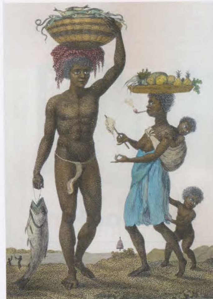
VERBONDEN SURINAAMS SLAVENGEZIN UIT BURKINA FASO. Ets uit 1792 van William Blake. Afbeelding Bridgeman Art Library

Was suiker in 1500 nog een zeer kostbaar goedje voor de allerrijksten, in 1800 werd het breed gebruikt in de koffie en thee