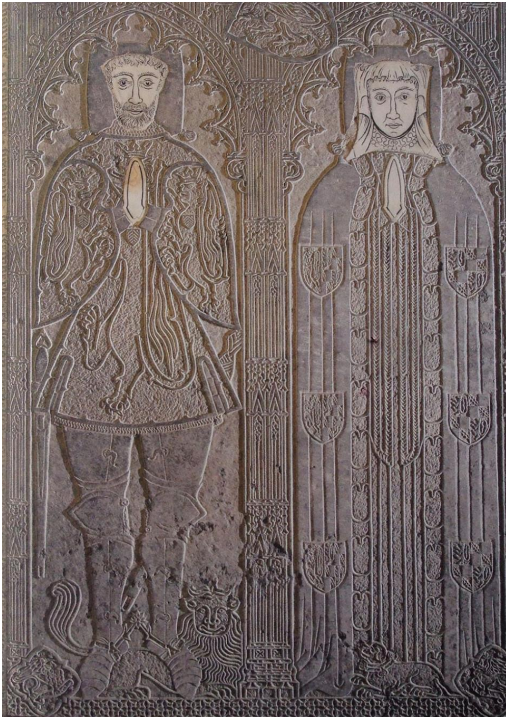
Afbeelding 10.2: Grafsteen van Willem van Gavre, heer van Steenkerke (+1447), en zijn echtgenote Beatrice du Bos, dame van Steenkerke (+1444), eerste raadsheer en eerste hofdame van Margaretha van Bourgondië in 1439, in de église Saint-Martin in Steenkerke, Henegouwen. 25