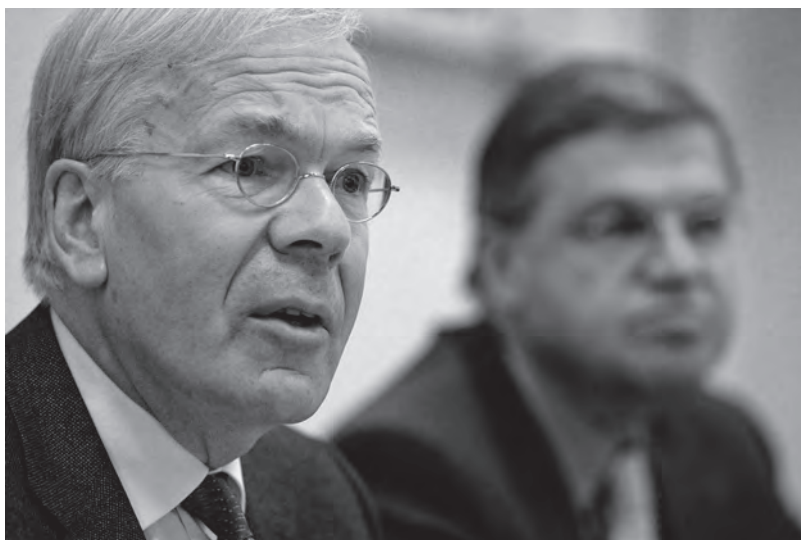
Vicepresident Herman Tjeenk Willink presenteert het jaarverslag van de Raad van State, rechts op de achtergrond Ernst Hirsch Ballin, op dat moment lid van de Raad, 26 april 2006.

Bovendien tekende zich een versterking van het rechtse blok af – waarin de PVV uitgesproken negatief was over zowel de Antillen