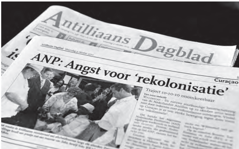
Op 4 oktober 2010, nog geen week voor de magische datum 10/10/10, kopt het Antilliaans Dagblad dat op de eilanden zorgen leven over 'rekolonisatie'.

Op de achtergrond van deze politieke processen speelden voortdurend ook electorale zorgen. Hier lijkt een duidelijk patroon zichtbaar.