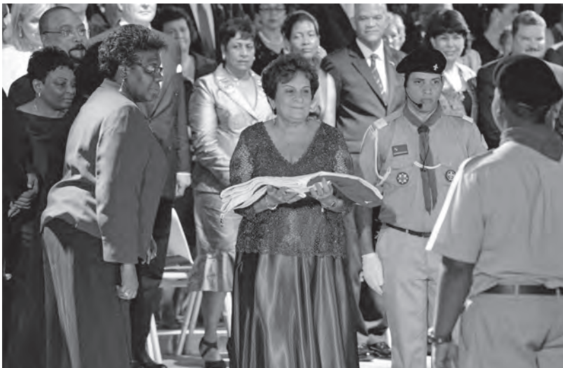
De laatste minister-president van de Nederlandse Antillen, Emily de Jongh-Elhage, neemt de vlag van de Nederlandse Antillen in ontvangst; rechts achter haar de laatste gouverneur van de Nederlandse Antillen, eerste gouverneur van Curaçao, Frits Goedgedrag; Curaçao, 9 oktober 2010.

De politieke strijd van het eilandelijk separatisme werd gevoerd met bestuurlijke argumenten, maar ook met een beroep op eilandelijke culturele eigenheid . Het eerste, ‘zakelijke’ type argument – de opgelegde, ‘koloniale’ constructie van vijf of zes eilanden bestuurd vanuit Curaçao was inefficiënt en riep voortdurend obstructie op – legde in