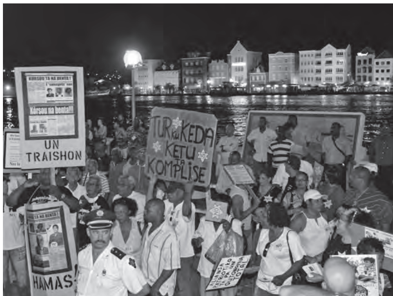
Betoging tegen 'rekolonisatie' door Nederland en het 'verraad' van de PAR tijdens de toetsings-RTC in Willemstad, 15 december 2008.

De Curaçaose afwijzing werd in Den Haag ervaren als een grote teleurstelling. Er werd echter 'geen millimeter ruimte' geboden om te heronderhandelen. Den Haag achtte het akkoord optimaal, volgens Nicolai had het zelfs een 'veel betere constructie' opgeleverd dan de status aparte van Aruba. 2 Dat Curaçao zichzelf nu buitenspel zette, noemde de bewindsman weliswaar 'onverantwoord' tegenover de bevolking, maar dit hoefde geen vertraging op te leveren voor de overige eilanden. In de Kamer bevestigde Nicolai dat de maatregelen, ook op financieel gebied, voor de K3 en Sint Maarten volgens het afgesproken schema uitgevoerd zouden worden; desnoods kon het Antilliaanse staatsverband alleen nog uit Curaçao blijven bestaan. Deze take it or leave it -houding richting Curaçao kon rekenen op de steun van de voltallige Kamer. Intussen werd Nicolai van ambtelijke