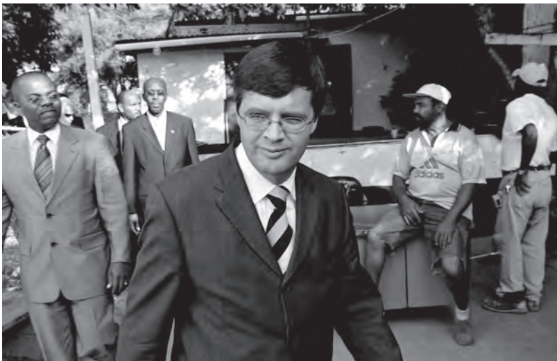
Jan Peter Balkenende op werkbezoek, Sint Maarten, 3 februari 2005. Links zijn ambtgenoot Etienne Ys.

Als niet op korte termijn werd ingestemd met het ‘Aanbod’ waren eenzijdige maatregelen van het Koninkrijk rond de openbare financiën onontkoombaar – via niet-vrijblijvende samenwerking