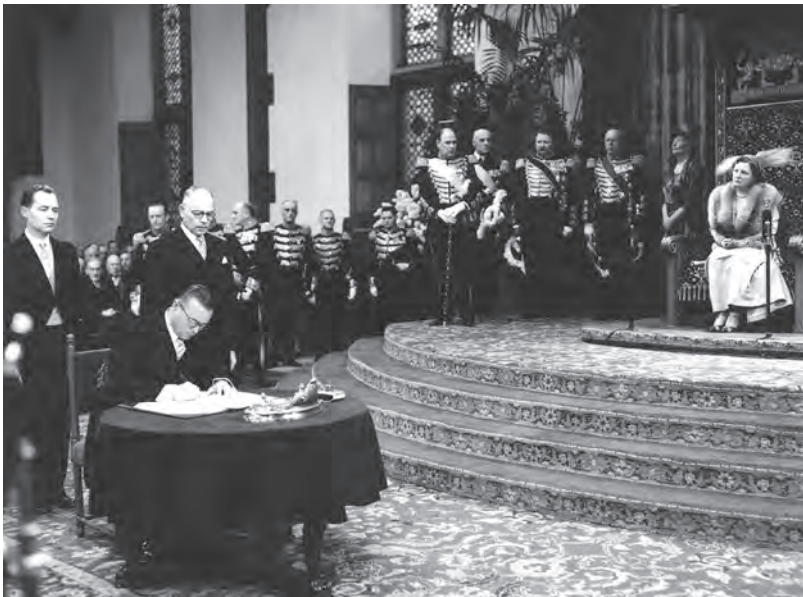
De Antilliaanse minister-president Efraïn Jonckheer ondertekent, toegekeken door koningin Juliana, het Statuut voor het Koninkrijk der Nederlanden in de Ridderzaal, Den Haag, 15 december 1954.

Wat dat laatste betreft, ging het om een drietal overwegingen. Allereerst, en aanvankelijk de grootste zorg, het besef wel verantwoordelijk te zijn voor het waarborgen van deugdelijk bestuur overzee, maar met het oog op de Caraïbische autonomie weinig speelruimte te hebben om in een vroeg stadium te voorkomen dat problemen ontstaan. Daaraan was althans in eerste instantie, met mei 1969 nog vers