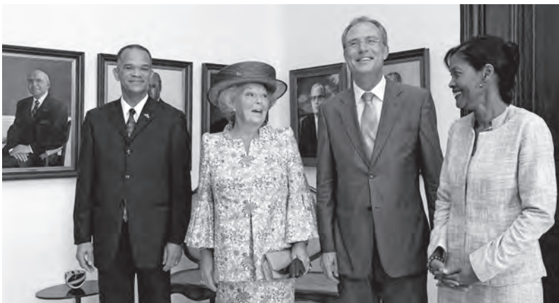
Koninklijk bezoek, Curaçao, 12 november 2006; v.l.n.r. gouverneur Frits Goedgedrag, koningin Beatrix, Atzo Nicolaï, Dulcie Goedgedrag-Terborg; op het portret links van Goedgedrag diens voorganger Jaime Saleh.

Het Koninkrijk verkreeg daarnaast ruim toezicht op justitieel terrein. Nederland had na lange aarzeling – mede van de tussentijds op Justitie teruggekeerde bewindspersoon Hirsch Ballin – er wel mee ingestemd dat de twee nieuwe landen elk een eigen politiekorps en Openbaar Ministerie zouden krijgen, maar er zou één procureur-generaal blijven, met verantwoordelijkheid voor alle vijf eilanden. Bovendien zou de Nederlandse minister van Justitie de bevoegdheid krijgen om namens de Rijksministerraad, dus als bewindspersoon voor het Koninkrijk, aanwijzingen te geven aan de procureur-generaal. Deze speciale aanwijzingsbevoegdheid maakte daarmee onlosmakelijk deel uit van de staatkundige vernieuwingen – onder zware druk van Hirsch Ballin en Nicolaï, zeer tegen de zin van de Antilliaanse onderhandelaars. 250 Nederland (i.c. de minister van Justitie) zou ook verantwoordelijk blijven voor de bestrijding van grensoverschrijdende criminaliteit, corruptie en integriteitschendingen. De nieuwe landen zouden gaan samenwerken in een Gemeenschappelijk Hof van Justitie (Nederland, Curaçao en Sint Maarten). Er zouden stringente afspraken worden gemaakt over verbetering van de poli-