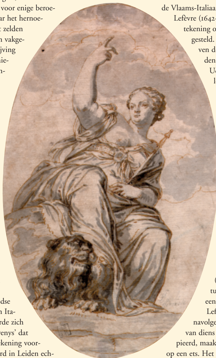
Valentin Lefèvre, Venetië op een globe zittend , tekening.

In een recent verschenen monografie over de Vlaams-Italiaanse kunstenaar Valentin Lefèvre (1642-circa 1700), wordt de tekening overtuigend op diens naam gesteld. De monografie, geschreven door Ugo Ruggeri, verbonden aan de Universiteit van Udine in Noord-Italië, catalogiseert het gehele oeuvre van de kunstenaar, schilderijen, tekeningen en etsen. De auteur heeft de Leidse tekening als een werk van Lefèvre herkend op basis van een foto. Wat hij niet kon weten is dat op de achterzijde een afgesneden opschrift te lezen is, dat luidt: Lefe.../ 2 f... Bij het uitknippen van de ovale voorstelling langs de rand is de naam van de kunstenaar dus ten dele verloren gegaan. Het restant van het opschrift (waarschijnlijk geen signatuur) is nooit herkend als een verwijzing naar Lefèvre. Lefèvre, die een enthousiast navolger was van Veronese en veel van diens composities heeft gekopieerd, maakte de tekening met het oog op een ets. Het Prentenkabinet bezit deze ets niet, maar wel een dertigtal andere voorbeelden van zijn prentkunst, vrijwel alle kopieën naar schilderstukken van Veronese en Titiaan. En nu dan ook een tekening, ontruikt aan een bestaan als anonieme kopie.