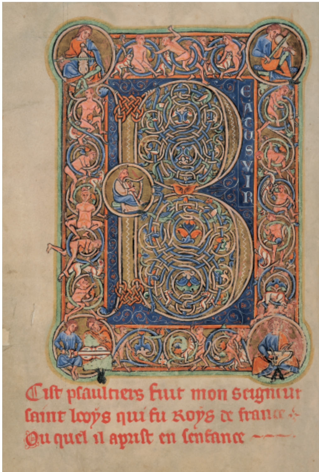
Initiaal uit het Psalterium van Lodewijk de Heilige [Handschrift, BPL 76a, folio 30v].