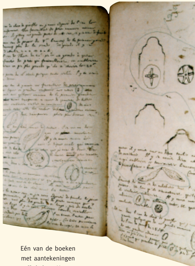
Eén van de boeken met aantekeningen van Christiaan Huygens, ‘Book E’ [UB HUG 9], de band voor restauratie.

Dit conserveringsproject betekent een langere levensduur voor deze belangrijke cultuurhistorische collectie en een betere toegankelijkheid van de stukken voor wetenschappers.