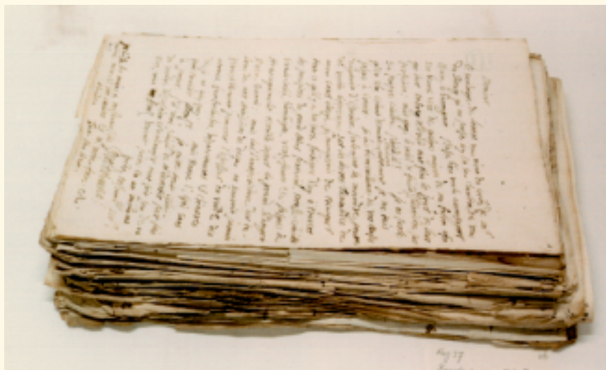
Een stapel brieven aan Constantijn Huygens [UB HUG 37] met omgekrulde en ingescheurde randen.