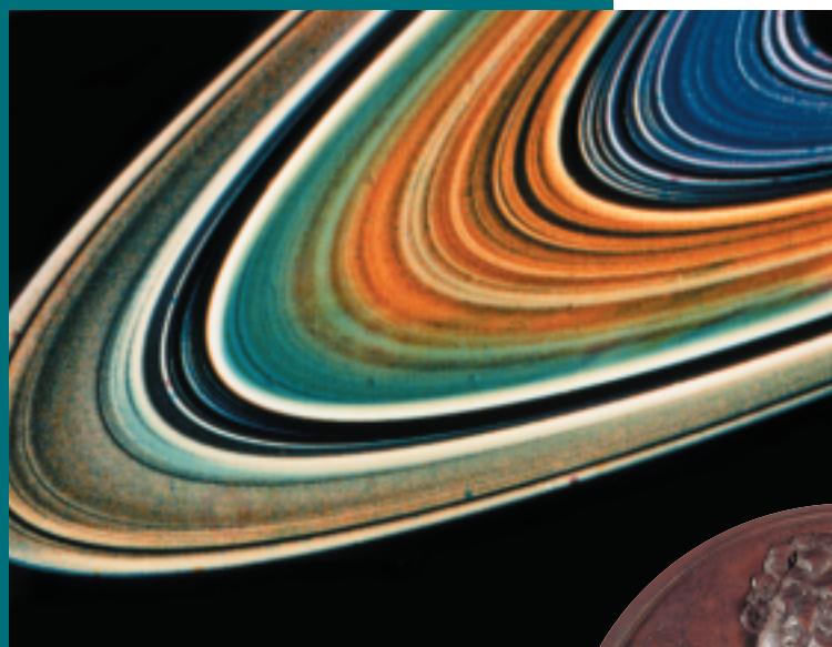
Een occultatie van de sterrendelta Sco op de ringen van Saturnus.

'Mijne schriften van Mathematycke [...] bestaende in negen ingebonden boeken met de letters van A tot I gemerckt ende voorts in veel tractaten dien ick onder hande hadde, legatere ick aan de Academie ofte Bibliothecq van Leyden [...]. Ik legatere mede aan deselve Bibliothecq de pacquetten daarop geschreven staat Literae doctorum off eruditorum leggende