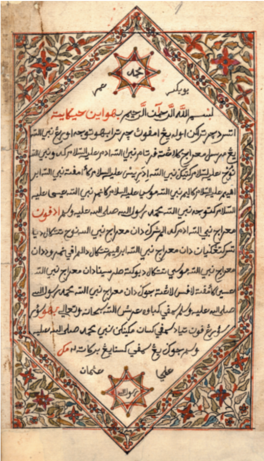
Versierde openingsbladzijde van de Maleise romance Hikayat Muhammad Hanafiyah (Or. 26.328).

Eerder al had ik van Van Stockums directeur te horen gekregen dat de erven Pijper van zins waren om een kleine verzameling brieven, gewisseld tussen G.F. Pijper en de legendarische Nederlandse islamoloog C. Snouck Hurgronje (1857-1936), aan de Leidse bibliotheek te schenken. Dit betrof een correspondentie van enkele tientallen brieven tussen Pijper en Snouck Hurgronje in de periode tussen 8 januari 1927 en 8 oktober 1935. De overdracht vond op feestelijke wijze plaats op 6 november 2003 ten kantore