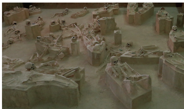
Figura 7. Museo de El Chorro de Maíta, Cuba; vista de reproducciones de restos humanos.

El sistema de encomiendas muestra las transformaciones que tuvieron lugar a principios del siglo XVI, cuando los asentamientos indígenas fueron sometidos a un régimen de dominación por los españoles y sus poblaciones fueron complementadas por esclavos africanos e indígenas no locales. Bajo el control de los colonizadores, poblados como el Chorro de Maíta, en el noreste de Cuba, se vieron obligados a aceptar costumbres y tradiciones cristianas y a proporcionar mano de obra a las empresas coloniales españolas (Valcárcel Rojas, 2016; Weston & Valcárcel Rojas, 2016). Con el sistema de encomienda, las sociedades y culturas indígenas cambiaron radicalmente, pero también tuvieron la capacidad de (re)negociar ciertos aspectos de sus identidades previas al contacto y de sus prácticas de cultura material. Este, fue uno de los escenarios y una de las estructuras coloniales donde el llamado “indio” comenzó a emerger como una categoría y una forma de identidad colonial (Valcárcel Rojas et al., 2014).