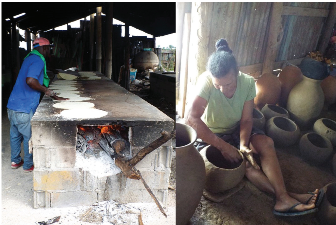
Figura 9. Actividades relacionadas con legados culturales indígenas en la actualidad.

Producción de casabe en San José de Las Matas. Cordillera Central. República Dominicana (izquierda). Confección de ollas y recipientes de cerámica utilizando técnicas tradicionales. Poblado de Higuerito. Valle del Cibao. República Dominicana (derecha).