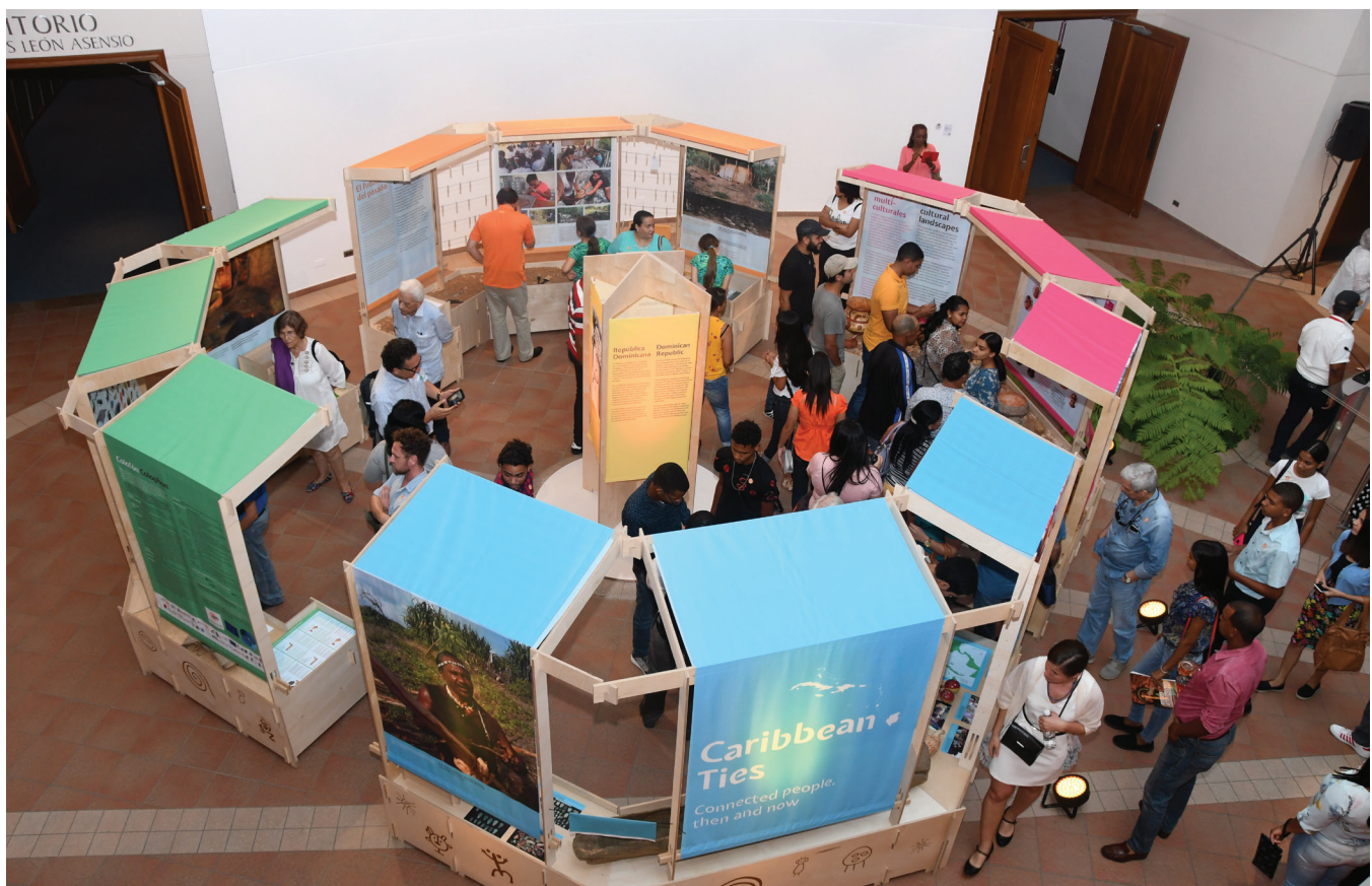
Figura 1. Inauguración de la exposición Lazos Caribeños en la sede del Centro Cultural Eduardo León Jimenes. República Dominicana.

locales y comunidades indígenas en todas las etapas de sus investigaciones; implementar una arqueología comunitaria y una práctica arqueológica descolonizadora a través del intercambio de conocimientos, programas educativos (e.g. Con Aguilar, 2019; Stancioff, 2018) y divulgación pública, entre los que resaltan, la organización de varios seminarios académicos (Ulloa Hung & Valcárcel Rojas, 2016; 2018), la exposición Lazos Caribeños , inaugurada en la sede del Centro Cultural Eduardo León Jimenes de República Dominicana y de manera paralela en varios países del Caribe, y el documental El retumbar del Caribe indígena producido por Pablo Lozano a partir de la colaboración científica y académica con el Instituto Tecnológico de Santo Domingo (INTEC).