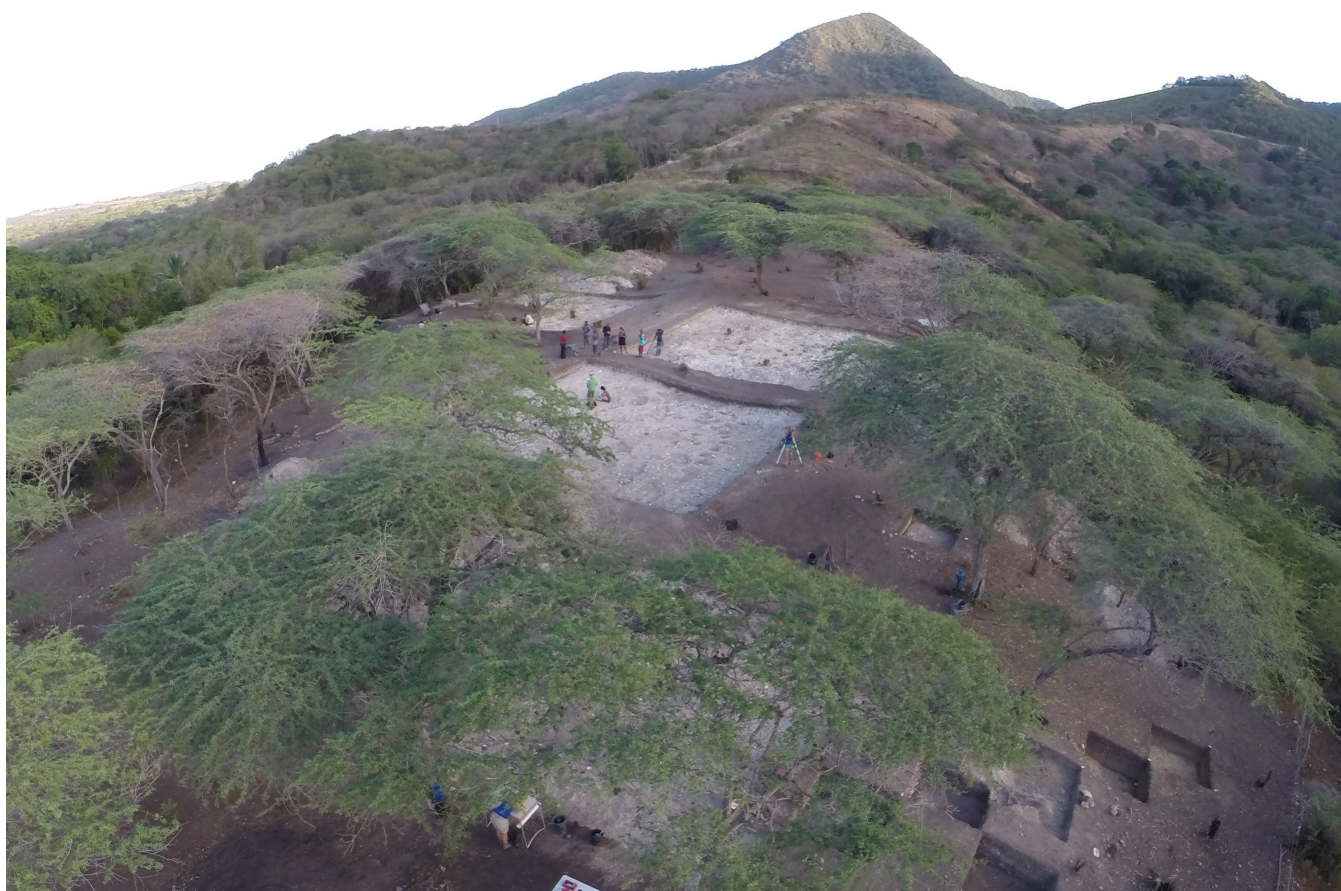
Figura 4. Excavaciones extensas en el asentamiento El Flaco cercano al llamado Paso de Los Hidalgos en la llamada Ruta de Colón.

Los sitios registrados representan solo una pequeña parte de los asentamientos que existían, debido a las enormes transformaciones del terreno generadas a partir de la colonización. Desde sus inicios, la introducción de ganado y diversos cultivos cambiaron drásticamente el paisaje (Castilla Beltrán, 2018; Hooghiemstra et al., 2018). Además, el reciente e intenso cultivo de arroz y plátanos en la zona borró aún más la historia de los asentamientos indígenas.