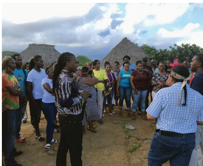
Figura 8. Garifunas y kalinagos visitando el poblado Cayo, construido experimentalmente en la localidad del asentamiento arqueológico de Argyle en San Vicente.

Cayo referencia la existencia de un patrón comercial entre los kalinago y los europeos (Hofman, 2019). Los kalinago probablemente participaron en un complejo sistema transatlántico en el que se combinaron sus conocimientos sobre intercambio y redes sociales de alianzas con las nuevas estrategias comerciales de las potencias coloniales europeas. Estas comunidades indígenas estaban encapsuladas en los territorios de expansión de estas potencias, sin embargo, disfrutaban de un alto grado de autonomía y tuvieron capacidad para renegociar su situación en esa nueva realidad caracterizada por la nueva afluencia de gentes, bienes e ideas (Hofman et al., 2014).