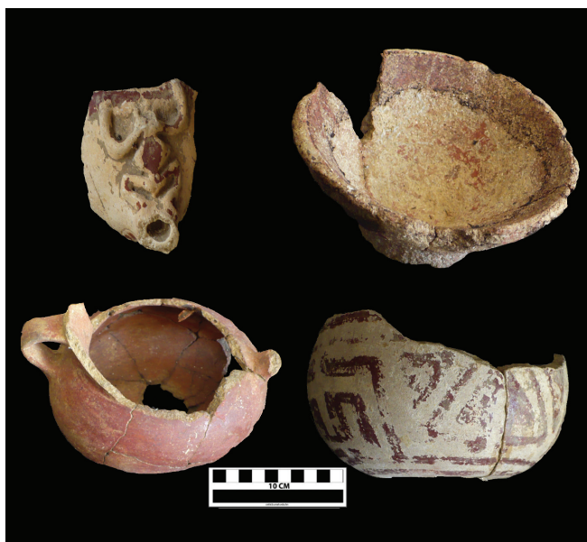
Figura 6. Vasijas con atributos de tradición indígena de la antigua villa española de Concepción de La Vega.