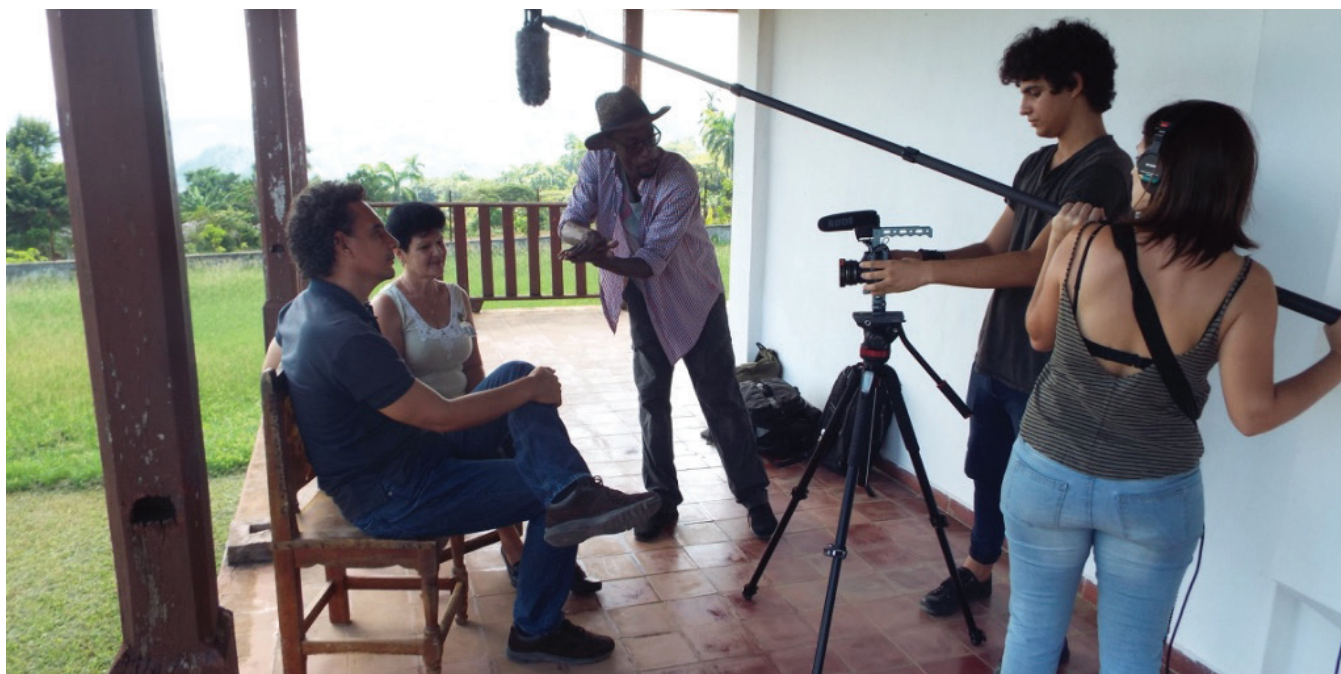
Figura 2. Proceso de grabación de entrevistas y recopilación de datos para el documental. El retumbar del Caribe Indígena . Museo de sitio El Chorro de Maita, Cuba.