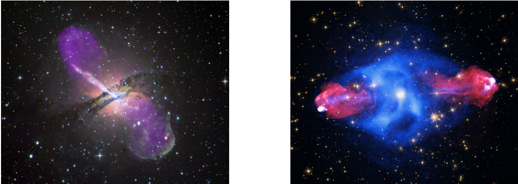
Figuur 2: Voorbeelden van typische Fanaroff-Riley FRI en FRII bronnen. Links : FRI radiosterrenstelsel Centaurus A. De kleur paars laat de radio-emissie zien (Bronnen: Röntgen: NASA/CXC/CfA/R.Kraft et al; Radio: NSF/VLA/Univ.Hertfordshire/M.Hardcastle; Optisch: ESO/WFI/M.Rejkuba et al.). Rechts : Cygnus A, het archetypale FRII radiosterrenstelsel. De kleur rood laat de radio-emissie met typische heldere rand zien. (Bronnen: Röntgen: NASA/CXC/SAO; Optisch: NASA/STScI; Radio: NSF/NRAO/AUI/VLA).

len van lokale radiosterrenstelsels en het is niet duidelijk of deze verschillen intrinsiek zijn of aan omgevingsfactoren liggen. Een van de meest intrigerende verschillen tussen lokale en verre radiostelsels is dat hoe verder een radiostelsel ligt, hoe steiler zijn radiospectrum is (de maat van steilheid is de spectrale index parameter, \alpha ). De relatie tussen de spectrale index in het radiogebied en de roodverschuiving (een astronomische afstandsmaat) is in het verleden succesvol toegepast om de verst afgelegen radiosterrenstelsels te vinden. Desondanks is de oorzaak van deze relatie onbekend.