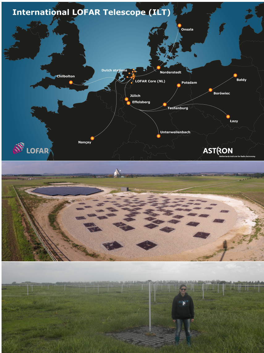
Figuur 4: Boven : De locaties van LOFAR-stations. De data in dit proefschrift werd genomen voor de bouw van de stations in Polen, toen de langste basislijn lag tussen Onsala en Nançay (1292 km). Midden : Het LOFAR-UK-station in Chilbolton. De LBA-antennes liggen op de voorgrond met daarachter de HBA-antennes bij elkaar onder een weerbestendige bedekking. Onder : Dipolen van een LBA-station in de centrale kern van LOFAR, met de auteur voor schaal.