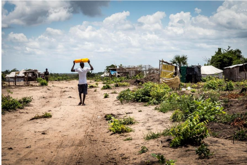
Fig. 5 – Vegetação no novo reassentamento de Mutua.

Em termos de instalações e serviços é visível que o local ainda se encontra em construção. Embora já existam alguns edifícios que poderiam funcionar como salas de aula, até agora só existe educação para os três primeiros anos da escola primária. Não há professores nem equipamentos disponíveis e as salas de aula - construídas com o apoio da igreja católica - permanecem vazias. Uma tenda serve de centro de saúde, mas está equipada apenas com uma caixa de madeira vazia (Fig. 6). Era suposto uma enfermeira ir duas vezes por semana ao reassentamento de Mutua, mas estando grávida não se consegue deslocar, deixando o reassentamento sem qualquer cuidado médico durante a maior parte do tempo. Na área próxima à entrada do reassentamento há muitas latrinas públicas mas, nas áreas mais distantes, as latrinas parecem ser menos numerosas. Um funcionário de uma agência humanitária disse-nos que o objectivo era que cada casa tivesse a sua própria latrina, mas muitas ainda estavam claramente em construção. Há 6 torneiras de água disponíveis para uso público, mas nas zonas mais altas do local a água muitas vezes não chega à torneira e as pessoas recorrem a poços de água à mão.