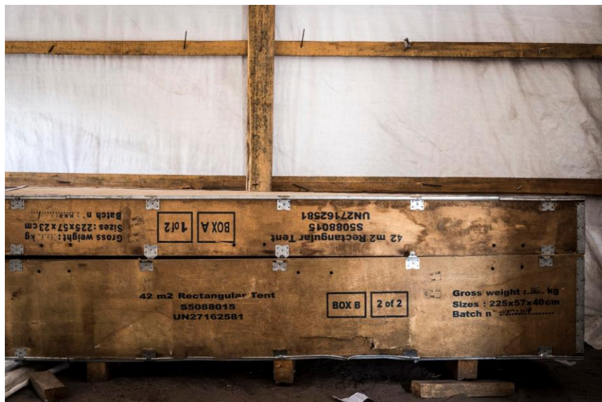
Fig. 6 – Centro de saúde no novo reassentamento de Mutua.

Em termos de instalações e serviços é visível que o local ainda se encontra em construção. Embora já existam alguns edifícios que poderiam funcionar como salas de aula, até agora só existe educação para os três primeiros anos da escola primária. Não há professores nem equipamentos disponíveis e as salas de aula - construídas com o apoio da igreja católica - permanecem vazias. Uma tenda serve de centro de saúde, mas está equipada apenas com uma caixa de madeira vazia (Fig. 6). Era suposto uma enfermeira ir duas vezes por semana ao reassentamento de Mutua, mas estando grávida não se consegue deslocar, deixando o reassentamento sem qualquer cuidado médico durante a maior parte do tempo. Na área próxima à entrada do reassentamento há muitas latrinas públicas mas, nas áreas mais distantes, as latrinas parecem ser menos numerosas. Um funcionário de uma agência humanitária disse-nos que o objectivo era que cada casa tivesse a sua própria latrina, mas muitas ainda estavam claramente em construção. Há 6 torneiras de água disponíveis para uso público, mas nas zonas mais altas do local a água muitas vezes não chega à torneira e as pessoas recorrem a poços de água à mão.