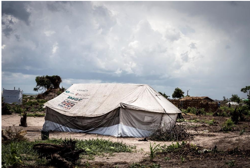
Fig. 3 – Tenda no novo reassentamento de Mutua.

Um número relativamente pequeno de pessoas tinha começado a construir as suas próprias casas, geralmente ao lado da tenda, com a tenda a servir de cozinha ou quarto extra. A maioria das construções são feitas de bambu e lama (pau-a-pique; Fig. 4). Para o telhado usavam plástico ou a lona de tendas antigas e cobriam-no com capim. Algumas pessoas estavam a construir com tijolos secos ao sol, mas estes não são tão resistentes às chuvas como tijolos cozidos. Olhando em volta é claro que seria difícil encontrar lenha suficiente para fazer tijolos cozidos. O local do reassentamento é bastante árido, com alguma vegetação baixa, mas quase não restam árvores grandes que, pelo que nos foi dito, tinham já sido cortadas (Fig. 5).