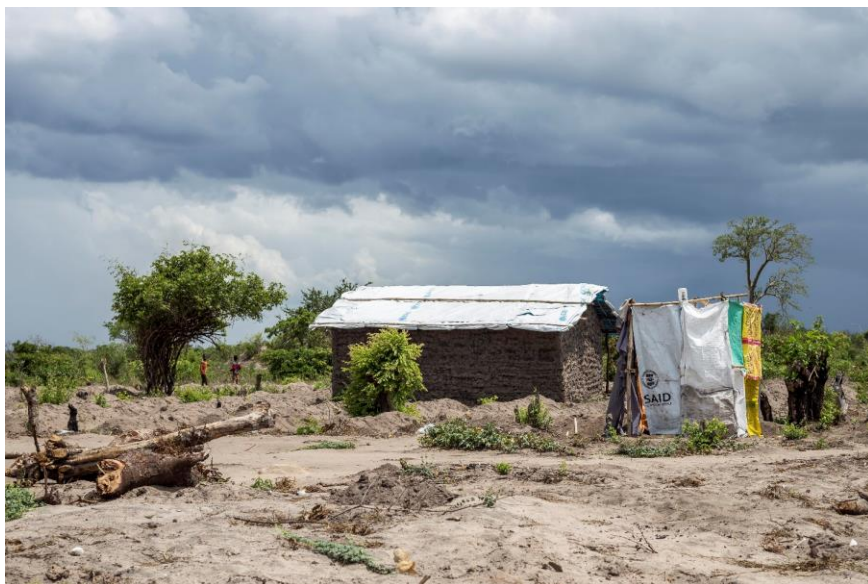
Fig. 4 – Casa de pau-a-pique no novo reassentamento de Mutua.

Um número relativamente pequeno de pessoas tinha começado a construir as suas próprias casas, geralmente ao lado da tenda, com a tenda a servir de cozinha ou quarto extra. A maioria das construções são feitas de bambu e lama (pau-a-pique; Fig. 4). Para o telhado usavam plástico ou a lona de tendas antigas e cobriam-no com capim. Algumas pessoas estavam a construir com tijolos secos ao sol, mas estes não são tão resistentes às chuvas como tijolos cozidos. Olhando em volta é claro que seria difícil encontrar lenha suficiente para fazer tijolos cozidos. O local do reassentamento é bastante árido, com alguma vegetação baixa, mas quase não restam árvores grandes que, pelo que nos foi dito, tinham já sido cortadas (Fig. 5).