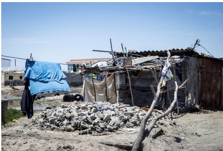
Fig. 2 – Casas destruídas na Praia Nova.

Andando na Praia Nova, é claro que muitas pessoas optaram por sair; pilhas de pedras de antigas casas testemunham o abandono pelo proprietário ou inquilino (Fig. 2). Mas muitas pessoas ficaram, mesmo no bairro habitacional onde muitos residentes não vivem da pesca. Quando o ciclone atingiu a Praia Nova, quase todos os nossos inquiridos fugiram do bairro (com excepção de um casal), quer para um dos centros de alojamento temporário, quer para a casa de familiares ou amigos que vivem em zonas mais seguras da cidade. De lá, a maioria deles regressou à Praia Nova passados alguns dias. Primeiro procuraram chapas de zinco para cobrir os seus telhados e, em alguns casos, tiveram de recuperar as paredes desmoronadas das suas casas. Naquela altura quase não havia chapas de zinco disponíveis à venda, mas podiam ser encontradas nas ruas onde o vento as tinha deixado. Algumas casas tiveram que ser completamente reconstruídas e os moradores aproveitaram para fazer a uma pequena elevação para evitar que a água entrasse na casa durante a maré alta.