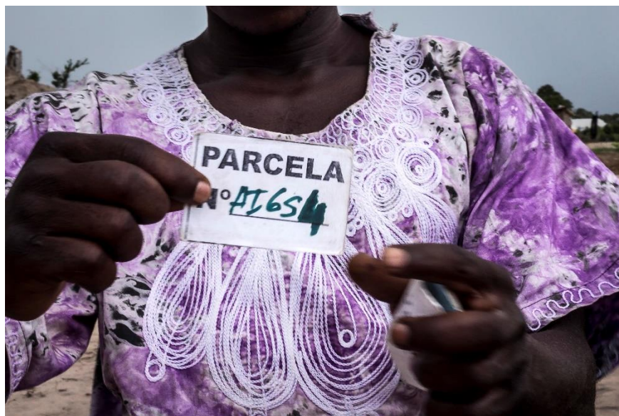
Fig. 7 – Documento temporário sobre a terra dado aos residentes.

Até agora as pessoas não receberam documentação definitiva dando-lhes o DUAT sobre as suas parcelas de terreno. Algumas pessoas mostraram-nos orgulhosamente o documento temporário que lhes foi dado pelas autoridades governamentais. No entanto, este documento era apenas um pequeno pedaço de papel, com um número manuscrito, mas sem nome nem qualquer outra informação relevante (Fig. 7). Mais detalhes sobre cada número são mantidos com as autoridades administrativas, mas foi-nos dito que apenas um nome por parcela era permitido. 35 As pessoas estavam cientes da importância do pedaço de papel e convencidas de que este acabaria por lhes dar os documentos formais. 36