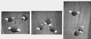
Fig. 2: Modellen van leerlingen uit project Ilona Hangyi

wat haar leerlingen door deze aanpak zouden leren over de aard en het gebruik van modellen. Bij de start van het project heeft ze leerlingen een reeks vragen laten bespreken, zoals 'wat is abstract?' en 'in hoeverre zijn modellen abstract?'. De instructie voor de groepsopdracht, 'bouw een concreet model', omvatte onder meer de richtlijn dat het om een concreet, driedimensionaal model moest gaan, dat 'in een schoenendoos moet passen'. De leerlingen moesten bovendien een toelichting bij hun model schrijven over de sterke en zwakke kanten van hun model en de relatie van dit model met het verschijnsel dat ermee verduidelijkt zou moeten worden. Tijdens de afsluitende workshop presenteerden leerlingen hun eigen model en bespraken daarnaast de modellen van enkele andere groepen aan de hand van een reeks vragen die door Ilona bij ieder model waren geformuleerd. Een voorbeeld van een product is te zien in figuur 2. Bij de analyse