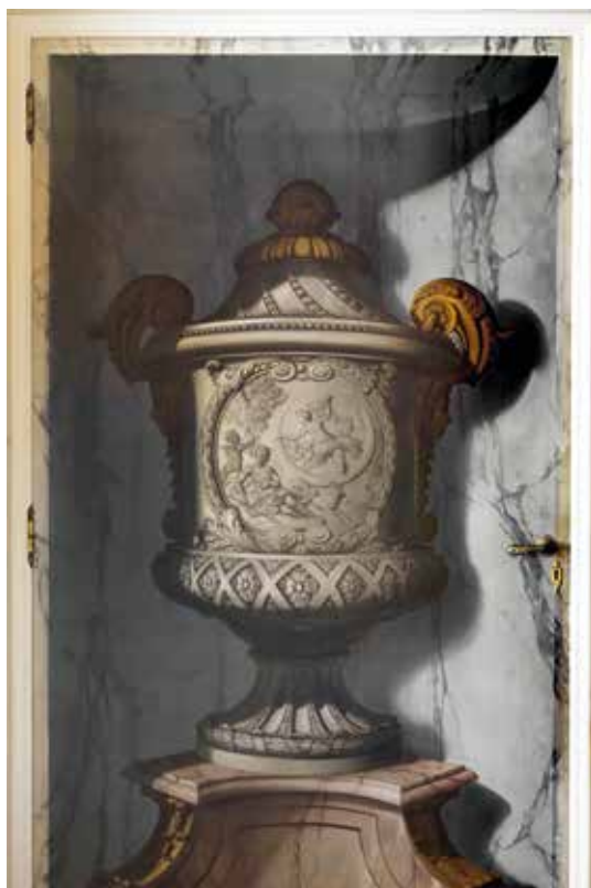
Zie afbeelding 100, hoofdstuk 8.

Vanaf 2004 is hij als bestuurslid verbonden aan de Stichting Dordts Patriciërshuis en sedert 2013 aan de Stichting Cornelis Bakker die de nalatenschap van de Rotterdamse kunstenaarsfamilie Hauck-Bakker-Van de Laar beheert. Hij is venoot van kunsthandel Ars Decora.