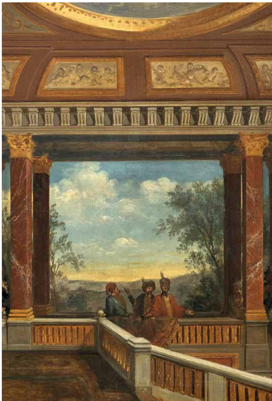
Zie afbeelding 48, hoofdstuk 8.