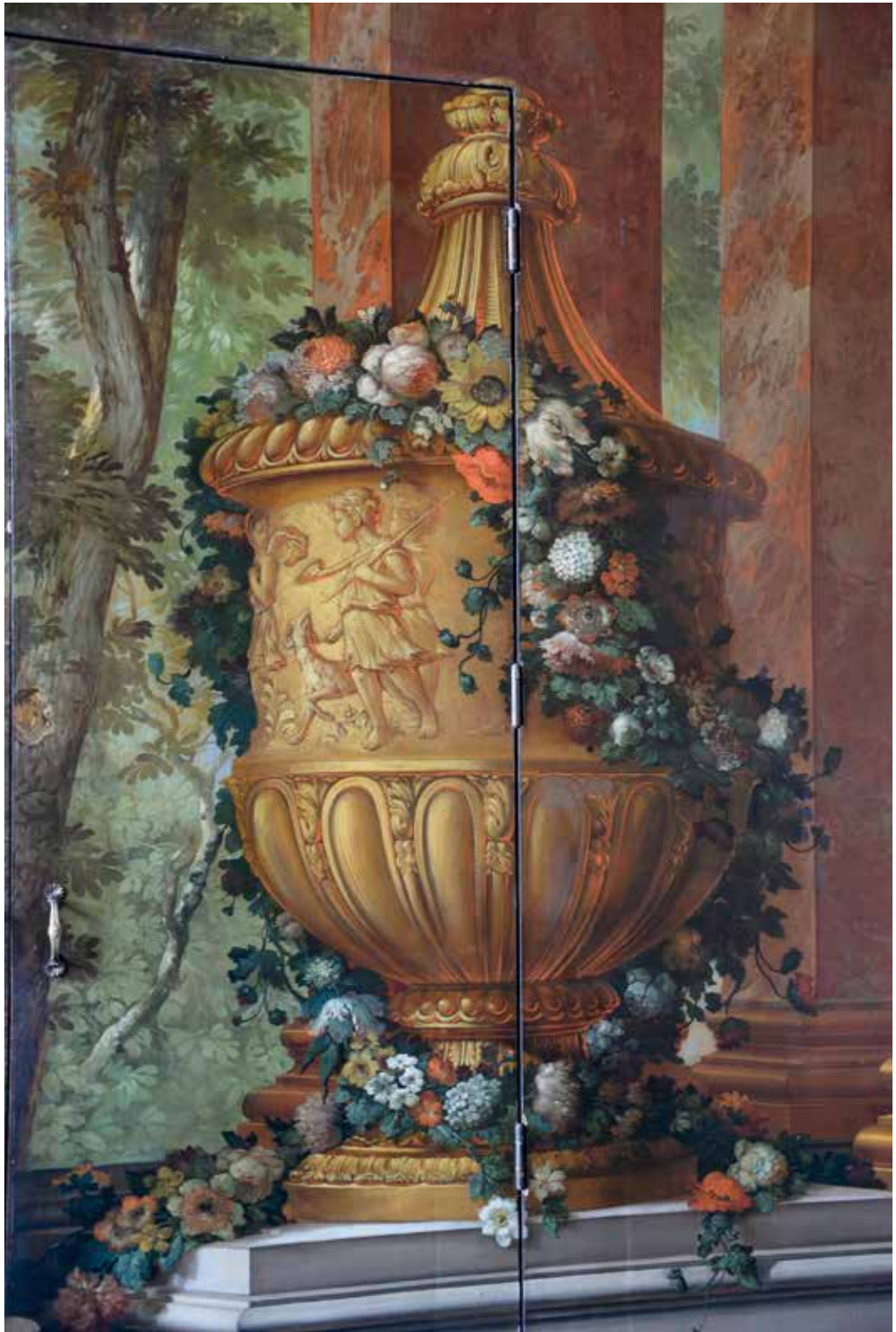
Zie afbeelding 52, hoofdstuk 8.