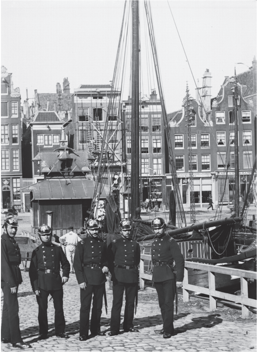
Illustratie 1 Amsterdamse politie op het Damrak (ca. 1892) (bron: Stadsarchief Amsterdam, Collectie Jacob Olie Jbz., 10019A000118).