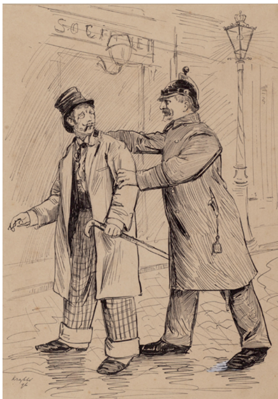
Illustratie 3 Een brigadier van politie arresteert een dronken man (ca. 1896).

dit tegen een brug in de Haven deed 17 , volstaan agenten in 1905 met de melding dat de verdachte heeft 'gewaterd [...] buiten de daartoe bestemde waterplaatsen' . 18