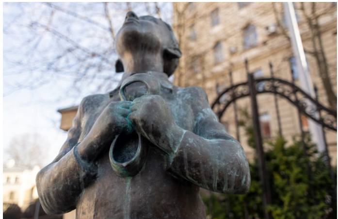
Figure 8.1 : Le monument à Gary à Vilnius (Evgenia Levin)

J'avais déjà près de neuf ans lorsque je tombai amoureux pour la première fois. [...] Elle avait huit ans et elle s'appelait Valentine... je levai les yeux vers la lumière pour la subjuguier. Mais Valentine n'était pas femme à se laisser impressionner... [...] Je mangeai pour ma bien-aimée un soulier en caoutchouc... 397