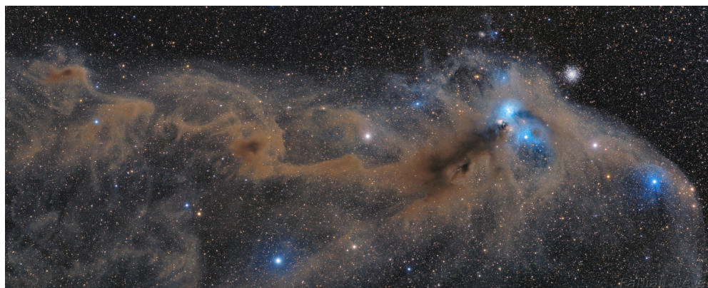
Figure 6.15: Vista della componente di polvere delle nubi nella regione di formazione stellare Corona Australis. Le nubi più dense sono in grado di bloccare efficacemente la luce proveniente dalle stelle più lontane.

momento angolare, fino a quando, ad un certo punto, la forza centrifuga è in grado di impedire l'ulteriore collasso del materiale. Viene dunque a formarsi una struttura a disco. Queste strutture sono chiamate dischi protoplanetari , e sono la culla della formazione dei pianeti.