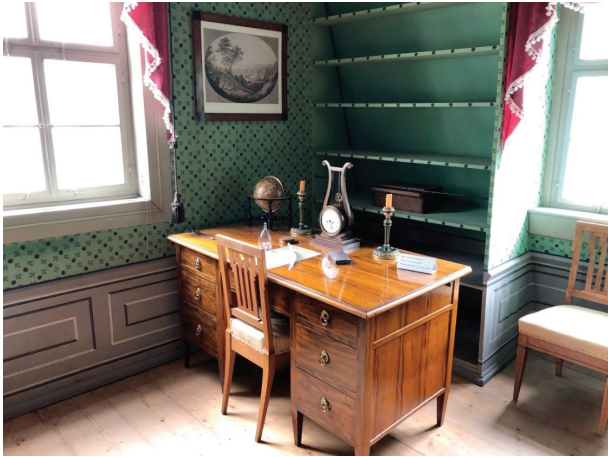
Het bureau van Schiller.

Ik ben drie keer teruggelopen naar Schiller's bureau. Af en toe kwam er een suppoost langs en een enkele bezoeker. Iedereen die ik daar zag hield gepaste afstand tot deze heilige plek. Een strengere bewaking was blijkbaar niet nodig. Toen ik voor de laatste keer de kamer uitliep, kwam er net een jonge man de kamer in. Hij keek wat schichtig om zich heen en boog zich daarna over het bureau van Schiller. Ik liep door, maar keek op de gang nog even om. De jonge man had blijkbaar gezien dat er geen suppoost in de zaal was en raakte heel even, met gepaste eerbied, het bureau van Schiller aan. Hij schrok toen hij zag dat ik omkeek en getuige was van zijn gedurfde daad.