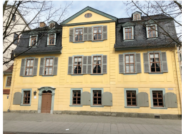
Het huis van Friedrich Schiller in Weimar.

toen al) hielden de Jena romantici op gepaste afstand. 1 De huizen van Goethe en Schiller staan er nog en zijn tegenwoordig te bezoeken. Voor mijn voorbeeld neem ik u mee naar het huis van Schiller.