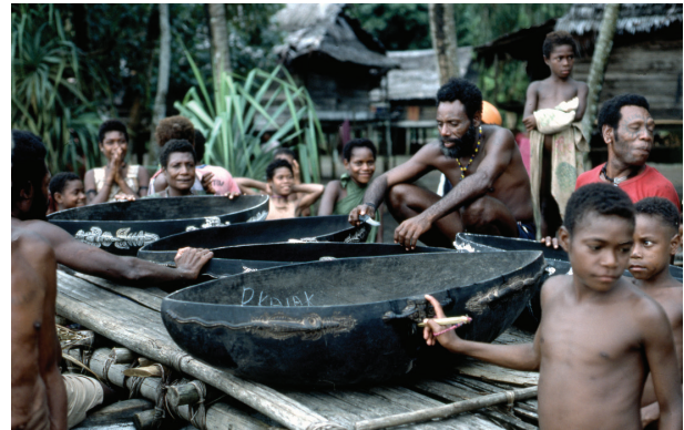
Onderhandelingen over de prijs van houten schalen van de Siassi eilanden, Aisega, Nieuw-Brittannië, december 1983.

Met betrekking tot de eerste categorie kunnen we uitgebreid te rade gaan bij de culturele antropologie. De vele handelssystemen die in de antropologische literatuur beschreven zijn leveren veel informatie op over hoe voorwerpen worden uitgeruild en welke mechanismen zorgen voor een gebalanceerde discussie over prijs en/of andere tegenprestatie. De belangrijkste grondleggers van deze discours zijn Bronislaw Malinowski met Argonauts of the Western Pacific (1922) en natuurlijk Marcel Mauss, met zijn Essai sur le don (1924/25). Zelf heb ik in 1983/84 onderzoek mogen doen in het Siassi handelsnetwerk, in Noordoost Nieuw-Guinea.