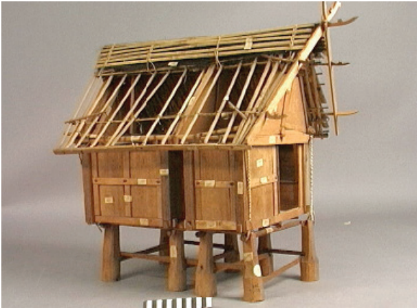
Een door Helfrich verzameld huismodel. Collectie NMVW 886-1.

onderscheidde hij maar liefst 119 onderdelen, alle voorzien van lokale naam. 15