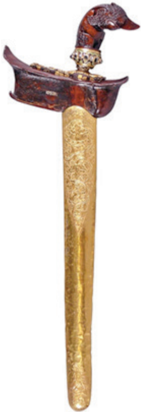
Kris Si Ginjai, Museum Nasional Indonesia. MNI 10921/E.263.

geladen politieke context. Vooral als het betreffende voorwerp in een depot wordt opgeborgen en niet openbaar toegankelijk is, neemt de invloed ervan af. Het wordt niet meer gezien en de documentatie wordt vergeten. Daardoor is vaak veel diepgravend onderzoek nodig om het voorwerp zijn betekenis, zijn kracht en invloed dus, weer terug te geven. Met onze verzamelpraktijken ontnemen wij dus niet alleen een eerdere eigenaar het fysieke voorwerp, maar ontdoen wij ook het voorwerp van zijn kracht, als het ware zijn functie in het leven. Dit brengt ons bij het laatste inhoudelijke gedeelte van deze oratie. De ethische aspecten van verzamelen.