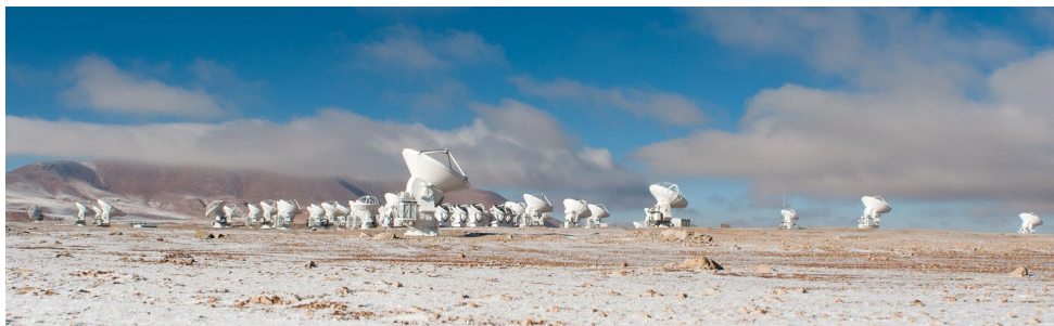
Figuur 2: In deze foto (gedeeld door de Joint ALMA Observatory) is een groot deel van de primaire ALMA-antennes te zien. Het werk dat in dit proefschrift wordt behandeld is gebaseerd op waarnemingen met deze telescoop – zie de verschillende Hoofdstukken 2 – 5 voor voorbeelden. Door de signalen van alle antennes aan elkaar te verbinden is het mogelijk om een extreem hoge resolutie en gevoeligheid te bereiken.

Zoals we hebben gezien is het dus mogelijk om populaties van protoplanetaire schijven te vinden van verschillende leeftijden op verschillende plekken in de – relatieve – buurt van de zon. Een belangrijke eerste vraag om te stellen is dan hoeveel sterren met een protoplanetaire schijf in een stervormingsgebied te vinden zijn, als fractie van de leeftijd van zo'n gebied. De conclusie van dit onderzoek, dat werd gedaan op infrarode golflengtes, is dat protoplanetaire schijven inderdaad zeldzamer zijn in oudere gebieden, zoals we zouden verwachten op basis van de theorieën van stervorming die hierboven zijn beschreven.