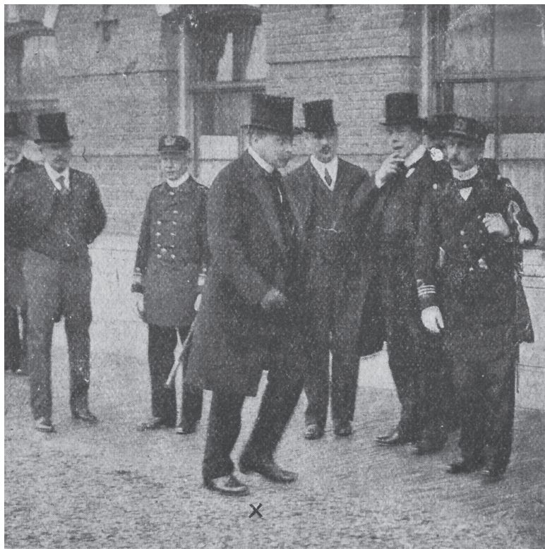
De Minister van Marine te Leiden.

Dat was nog niet het einde van de maritieme functie van de school als zodanig. De marine kwam met iets nieuws: er werd een korps 'Leerlingen-Officieren' opgericht. En waar zou de opleiding hiervoor beter kunnen plaatsvinden dan in Leiden, waar sedert een halve eeuw – nota bene in een binnenlandse fabrieksstad – een zeevaartschool was gevestigd die niet minder dan 13.284 jongens had opgeleid voor de marine: 632 De minister kwam er zelf voor naar Leiden.