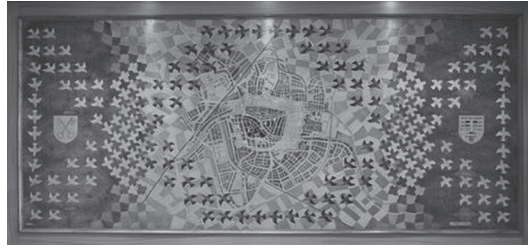
M. C. Escher, De groei van de stad Leiden vanaf 1186 tot 1940 (stadhuis).

Escher verbeeldde de groei van de stad in een paneel met verschillende kleuren hout waarbij vogels in- en uitgaande burgers verbeelden.