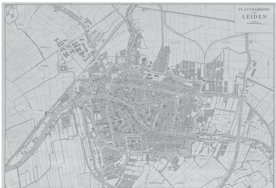
Leiden 1924, ELO PV 497

In de jaren dertig stelde het gemeentebestuur voor het eerst een samenhangend plan voor de ruimtelijke ontwikkeling van de stad als geheel vast: het Uitbreidingsplan 1933, onder meer gekenmerkt door scheiding van functies als verkeer, wonen (bijvoorbeeld het tuinstadconcept) en industrie. In dit plan waren niet alleen woningen opgenomen maar ook industrieterrinen, parken en plantsoenen en een infrastructuur voor de verbindingen tussen dat alles. 617