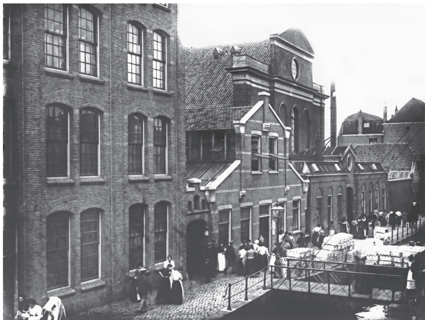
Conservenfabriek Tieleman & Dros 1900 (ELO PV 031152.4)

De armoede van de negentiende eeuw was nog lang niet voorbij. Nog steeds was een gemiddeld weekloon van een arbeider te laag om het gezin op minimaal niveau te onderhouden, zodat kinderarbeid het gezinsinkomen nog steeds moest aanvullen.