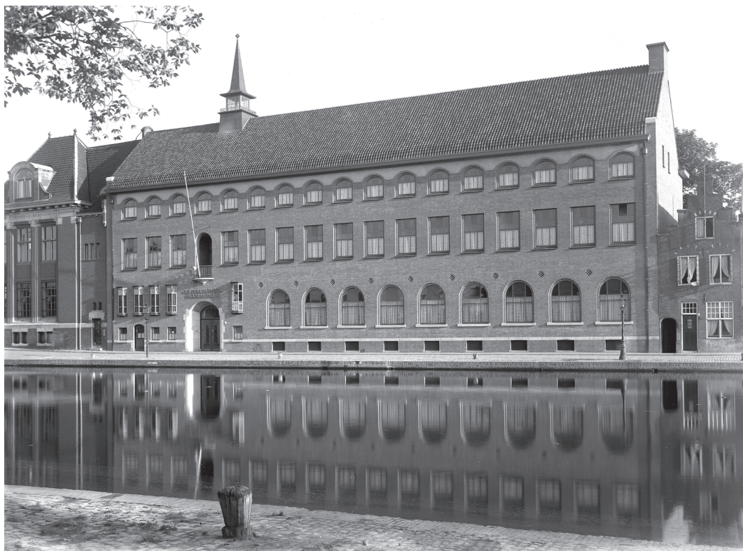
School aan het Galgewater begin 20e eeuw (ELO GN 006577).

Na eerst lokalen te hebben gebruikt in het Vincentiusgebouw aan de Hooglandse Kerkgracht, verwierf de vereniging in 1909 een eigen pand aan Noordeinde 50. Van daaruit werden heel wat aangrenzende panden verworven, aan het Noordeinde en aan het Galgewater, waardoor later nieuwbouw voor de school op eigen terrein mogelijk werd. Allemaal maatschappelijk initiatief, vooruitlopend op wat later rijksbeleid en -financiering zou worden.