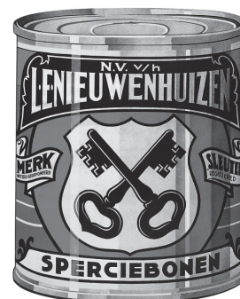
Blik met etiket merk De Sleutels 1925 (ELO L7)