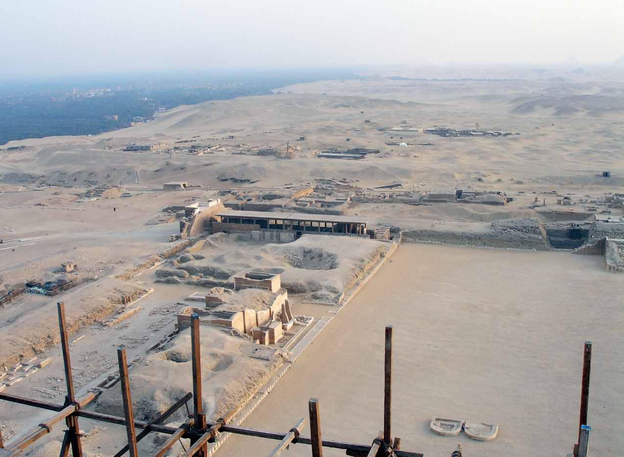
Afb. 3 Sakkara ten zuiden van de trappiramide van Djoser.

zullen daarom tegen het licht van nieuwe data en inzichten gehouden moeten worden.