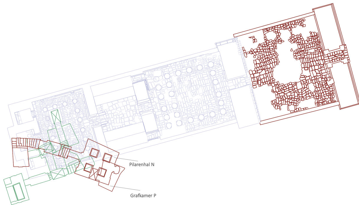
Afb. 6 De dodenstad Sakkara bezuiden de piramide van Djoser, Leids-Turijnse opgravingsconcessie, tijdens het Nieuwe Rijk. De grafstructuren in het blauw dateren tot de late 18 e dynastie en de structuren in het rood tot de 19 e en 20 e dynastie. Afbeelding: Nico Staring.

Ten eerste breidde de begraafplaats zich in noordelijke richting uit. Die ontwikkeling wijst mogelijk op het feit dat de vroegste tombes vlakbij de voornaamste toegangsweg tot het verhoogde woestijnplateau gebouwd werden. Hoewel er natuurlijk meerdere manieren waren om het plateau te bereiken, lijkt de wadi (droogstaande rivierbedding) met de moderne naam Tabbet el-Guesch de voornaamste kandidaat voor de hoofdtoegangsweg in het Nieuwe Rijk. Oudegyptische priesters die de Nieuwe Rijkstempel van Ptah in Memphis in een rechte lijn verlieten kwamen exact bij de ingang tot de wadi uit, een kleine 3 km naar het westen.