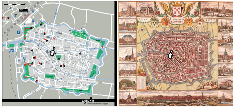
Afb. 2 Een moderne stadskarta van Leiden naast de kaart anno 1675. De pijl geeft de locatie van het straatbeeld in afb. 1.

lopen, zullen geen idee hebben van de voormalige aanwezigheid van de gracht. Maar toch beïnvloedt diezelfde gracht de manier waarop men zich door de stad beweegt.