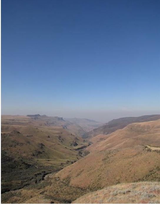
Uitzicht vanuit Lesotho over het lager gelegen Zuid-Afrika