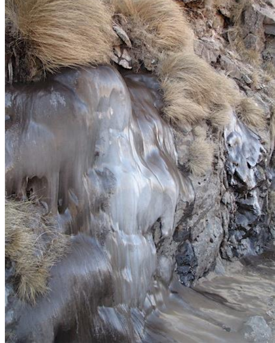
Bevroren waterval in Lesotho

Overdag, als de zon schijnt, is het er lekker fris. Maar 's nachts was het er -7 graden. Studenten en promovendi gebruikten (letterlijk) twee elektrische dekens. Nergens voor nodig natuurlijk. Met een lokale Lesotho blanket , die de inwoners er ook als kledingstuk gebruiken, kom je prima de nacht door.