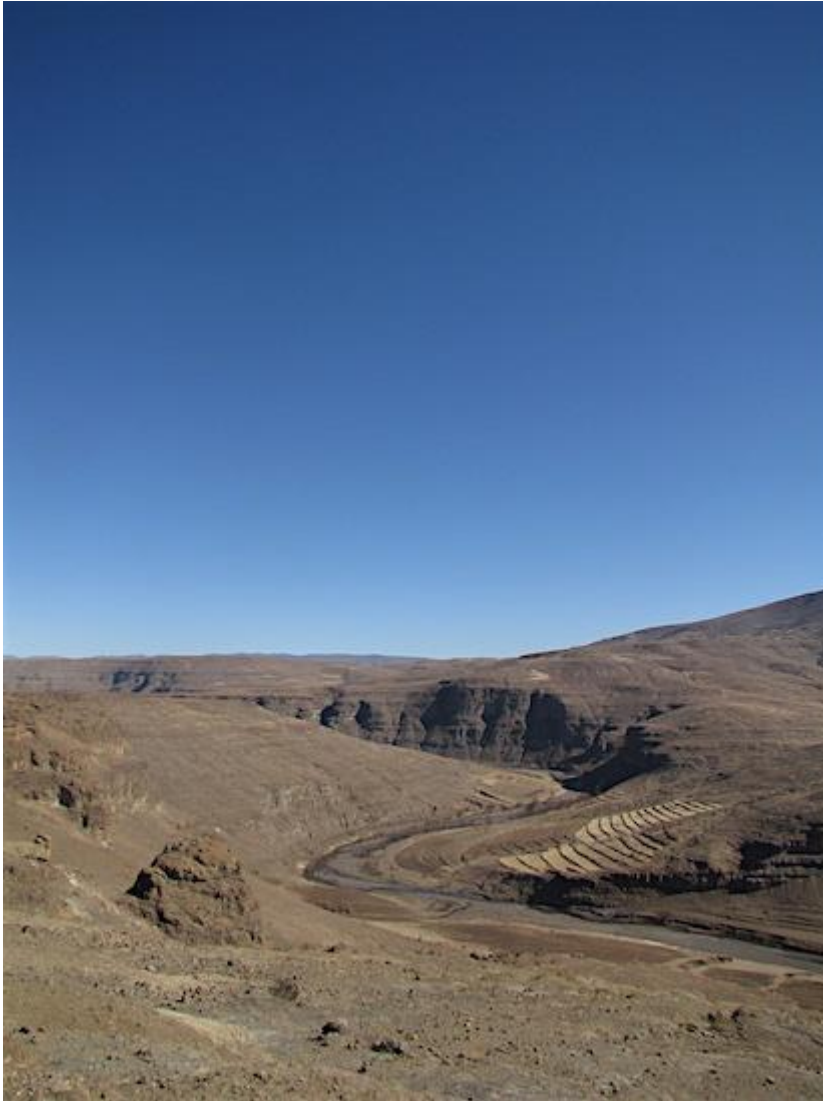
Uitzicht over het dal van de Senqu-rivier: een vlechtende rivier, zoals Rijn en Maas ook waren tijdens de laatste ijstijd.

De vele vondsten die we hebben gedaan, worden uiteraard ook verder bekeken. We vinden vooral veel werktuigen uit de periode tussen 65.000 en 60.000 jaar geleden. Dat kan betekenen dat onze vindplaats toen een favoriet kamp voor jager-verzamelaars was waar grote groepen mensen naartoe kwamen. Nu is het uitzicht vanuit onze abri over de vallei ontnomen door grote bomen met dichte lianen. Maar in een ijstijd zonder bos zou de rockshelter een ideaal uitzicht over door de vallei trekkende antilopes bieden. Eerder onderzoek naar de segmenten die we uit deze periode vinden (zie boven) wijst erop dat die misschien 's werelds oudste pijlpunten waren. Umhlatuzana als belangrijk jachtkamp: het is een van de ideeën die we verder onderzoeken. Hoe dan ook, op basis van de enorme hoeveelheid vondsten kan ik me niet aan de indruk onttrekken dat de ijstijd, in deze grot, wellicht helemaal niet zo problematisch was.