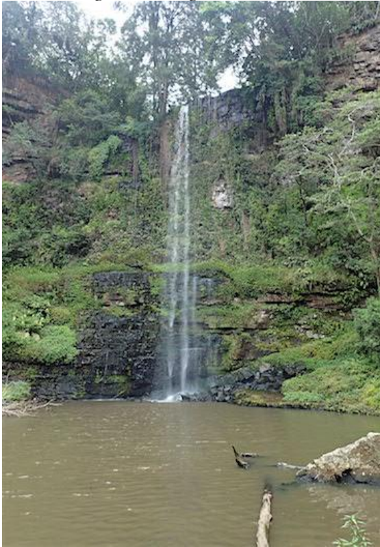
Waterval op weg naar de vindplaats, weelderig begroeid

Tijdens de laatste ijstijd was het kouder en zal het, ook bij onze vindplaats, regelmatig gevoren hebben. Maar het was waarschijnlijk ook droger. En dat betekent dat de vegetatie heel anders was dan tegenwoordig.