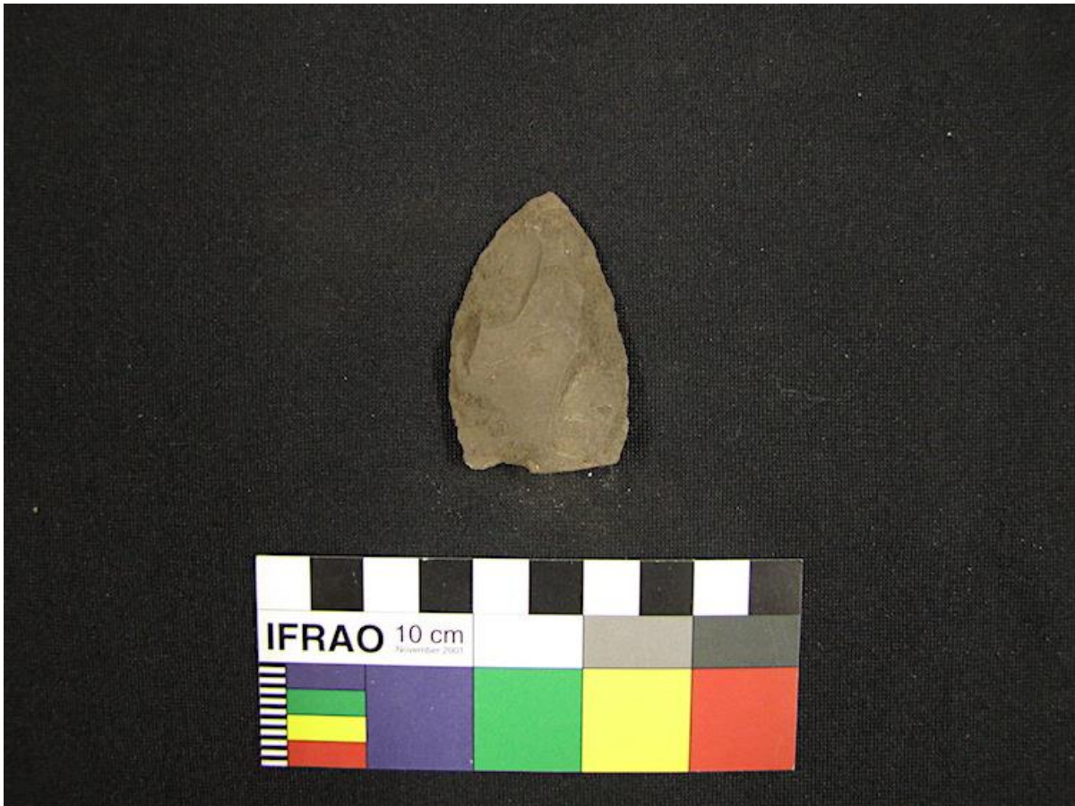
Een stenen spits tenminste 50.000 jaar oud, wellicht gebruikt als mes of speerpunt.

Dus: opgraven in Umhlatuzana is een privilege en een buitenkans. En veel vinden is dan toch een bonus?