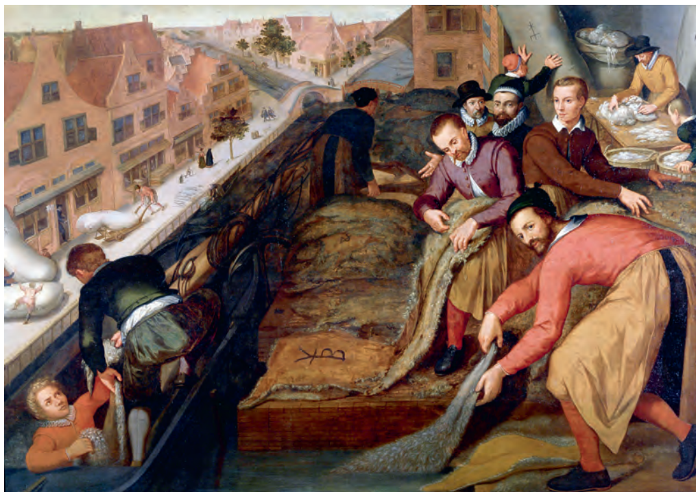
Afb. 2 Het wassen van de vachten en het sorteren van de wol in 1607 of 1612 in Leiden. Op de voorgrond halen twee mannen de schapenvachten uit een schuit. Rechts worden vachten gewassen. Links worden balen met scheerwol heen en weer gesleept. Schilderij van Isaac Claesz. van Swanenburgh, 1607-1612. Collectie Lakenhal, S419, Leiden.