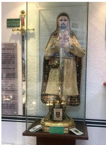
Imagen 7. “San Nazario”, protector de los Templarios, Museo del Narcotráfico, ciudad de México.

Las imágenes de San Nazario comenzaron pronto a circular en la Tierra Caliente entre los miembros de la Familia Michoacana y también entre pobladores de la zona. Una vez representado como icono religioso, se convierte en el santo patrón de los Caballeros Templarios, el protector de los miembros del grupo criminal.