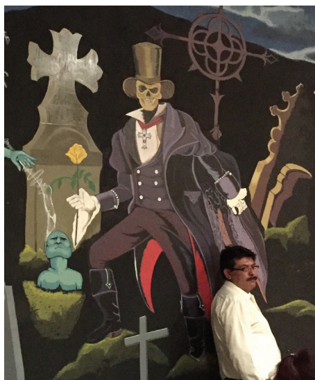
Imagen 2. La Santa Muerte representada como catrín , “catedral” de la Santa Muerte, Pachuca.

La ambivalencia de la Santa Muerte es notoria también entre sus devotos, entre quienes hay tanto criminales como sus víctimas, pero también policías, pidiendo todos igualmente protección. Vendedores ambulantes, sicarios, adictos, madres solteras con hijos desahuciados o estrés económico, trabajadores sexuales, transexuales, migrantes, parejas del mismo