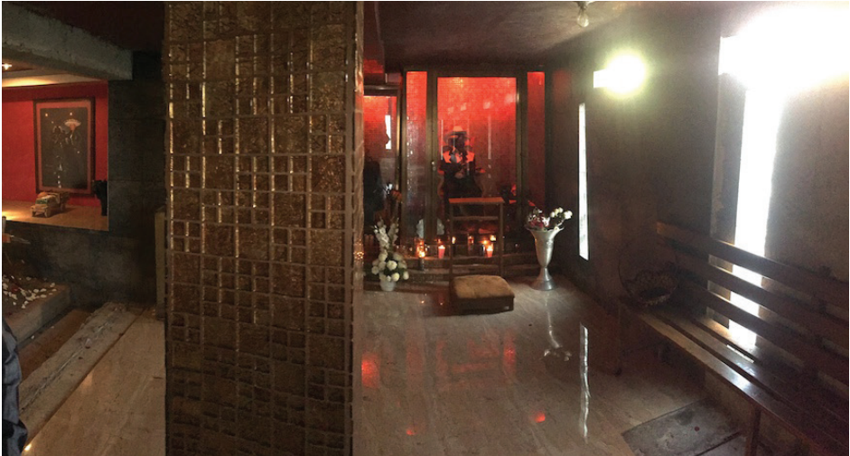
Imagen 4. Capilla del Angelito Negro, Pachuca.