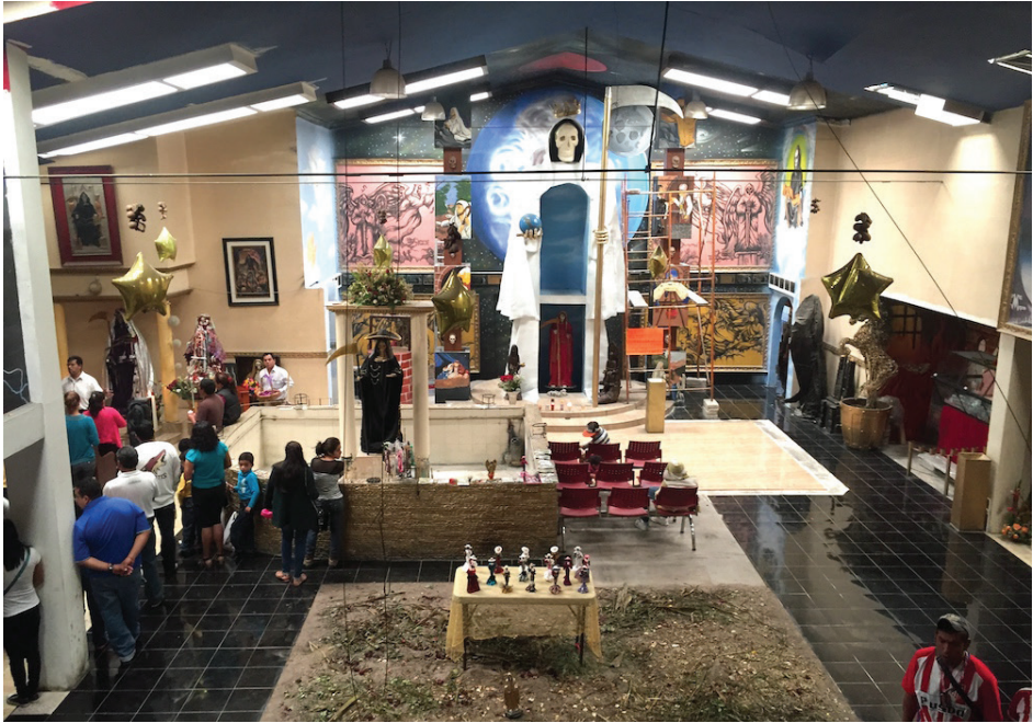
Imagen 1. Nave central de la “catedral” de la Santa Muerte, Pachuca.