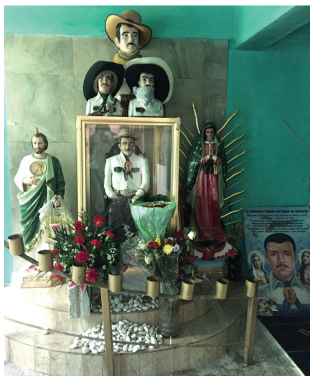
Imagen 3. Altar a Jesús Malverde, Virgen de Guadalupe y San Judas, “catedral” de la Santa Muerte, Pachuca.