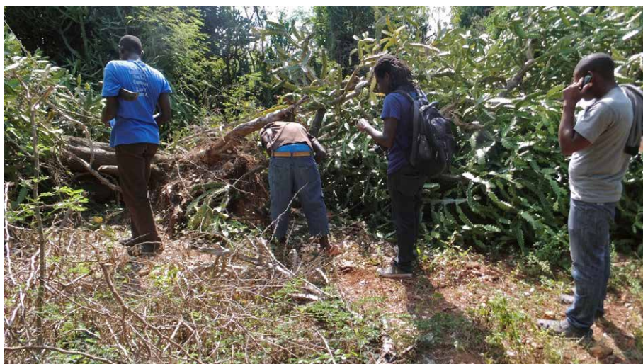
Figure 10 : prospections archéologiques.

Les nouveaux sites archéologiques répertoriés sont enregistrés à partir des positionnements de coordonnées d'un GPS portable et s'ajoutent à ceux déjà enregistrés par Clark Moore (Moore et Tremmel 1997), qui a recensé la grande majorité des sites amérindiens en Haïti. Ils sont enregistrés dans une base de données en fonction de leur caractérisation culturelle, de leur extension, de leur élévation et de leur distance à la mer. Tout en gardant les codes numériques des sites déjà inventoriés, une identification alphanumérique a été attribuée aux nouveaux. Elle comprend des lettres alphabétiques du nom de la localité dans laquelle le site a été découvert, suivies d'un code automatique de numérotage du GPS. Il se présente ainsi : FD26, dont FD est attribué à Foudoche (nom de la localité) et 26 représente le numérotage automatique du GPS.